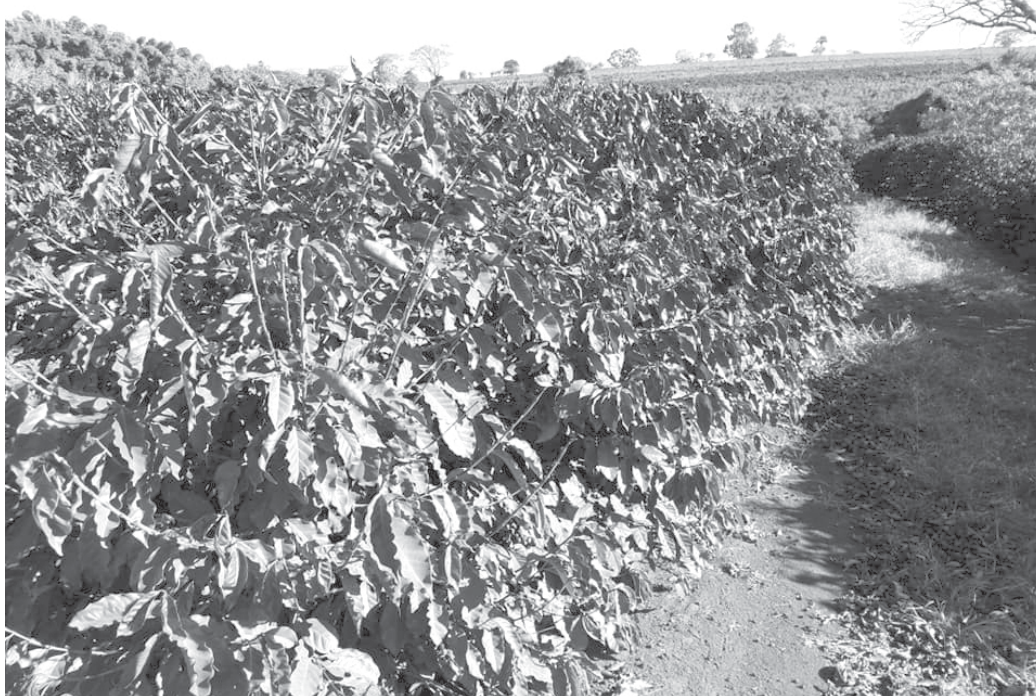
Várias lavouras na região da divisa entre Paraíso e São Tomás de Aquino registram queimadas nas plantas