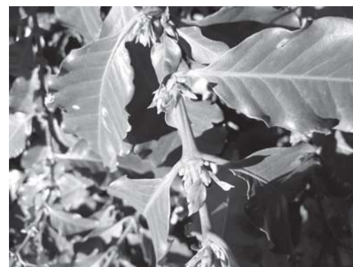
Levantamentos continuam sendo realizados, contabilizando eventuais prejuízos nas regiões produtoras de café