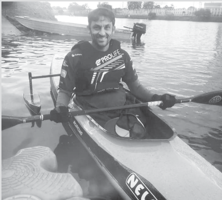
Atleta enfrentou dois dias intensos de provas e conseguiu ser campeão em todas