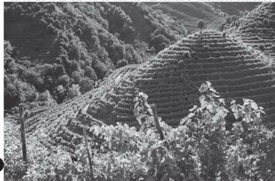
CONSORZIO TUTELA DEL VINO CONEGLIANO VALDOBBIADENE PROSECCO SUPERIORE D.O.C.G.

As colinas de Prosecco, que há séculos fazem parte da paisagem da região de Vêneto (nordeste da Itália), foram inscritas na Lista do Patrimônio Mundial da Unesco. Trata-se precisamente das colinas Conegliano e Valdobbiadene que produzem o famoso vinho branco espumante italiano. Essa área engloba uma superfície de cerca de 9,1 mil hectares caracterizada por encostas íngremes, pequenas parcelas de vinhas instaladas em terraços estreitos por fileiras de trepadeiras paralelas e verticais. No século XIX, a técnica de vinhas treliça, chamado bellussera, contribuiu para as características estéticas desta paisagem.