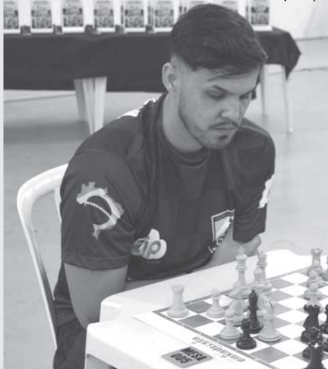
Representantes do CXSSP no IX Floripa Chess Open

Aconteceu no último sábado, dia 29 de abril, a V Etapa de Xadrez Rápido da Liga do Enxadrista 2023 na cidade de Franca SP.