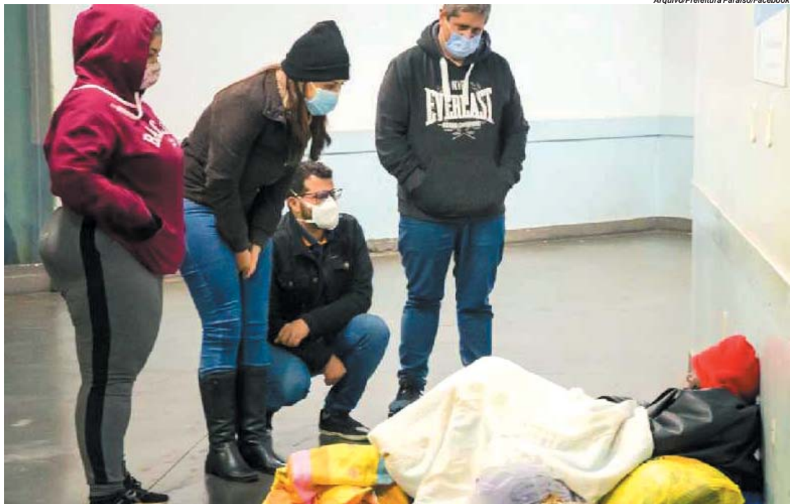
Equipe da Secretaria de Desenvolvimento Social quando abordava pessoas em situação de rua e encaminhá-las ao Albergue Noturno