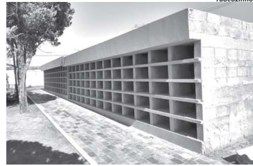
Em Paraíso, Cemitério Ecológico MEMORIAL da SAUDADE, em 1º de Maio de 2023 completou três anos de atividade e 130 gavetas do Ossuário Perpétuo quase pronto para funcionar