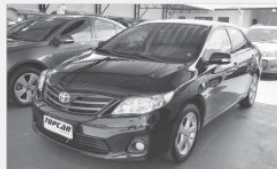
COROLA XEi 2014 - PRETO - AUT - COMPLETO + COURO