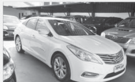
SONATA - 2012 - BRANCO - AUT - COMPLETO + COURO