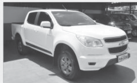
S10 ADVANTAGE - 2016 - BRANCA - COMPLETA - FLEX