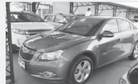
CRUZE LP - 2014 - CINZA - AUT - COMPLETO + COURO