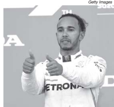
Hamilton pode carimbar o pentacampeonato, amanhã, em Austin