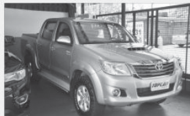
HILUX SRV DIESEL 4X4 - 2015 - PARTA - AUT - COMP + COURO