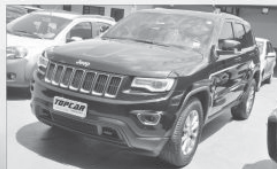
JEEP GRAND CHEROKEE LAREDO - 2014 - AUT - COMP + COURO