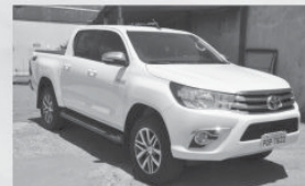
HILUX SRV DIESEL 4X4 - 2016 - BRANCA - COMPLETA + COURO

LOJA 1 AVENIDA ITÁLIA, 830 - JARDIM EUROPA SÃO SEBASTIÃO DO PARAÍSO - MG LOJA 2 AVENIDA MONSENHOR FELIPE, 1065 SÃO SEBASTIÃO DO PARAÍSO - MG 35 3531 2858 | 9 8707 1003