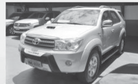
HILUX SW4 - 2011 - 7 LUG - CINZA - AUT - COMP + COURO