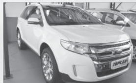
EDGE - 2013 - BRANCA - AUT - COMP + COURO