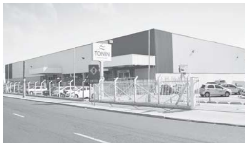
Fachada da loja de Ribeirão Preto localizada na Avenida Caramuru

Após quatro anos de implantação do projeto de Customer Relationship Management (CRM), que ajudou a estreitar e aperfeiçoar sua estratégia de relacionamento com os clientes, a Rede Tonin atingiu a sua meta com um ano de antecedência ao registrar um incremento de 20% nas vendas no segundo semestre de 2021.