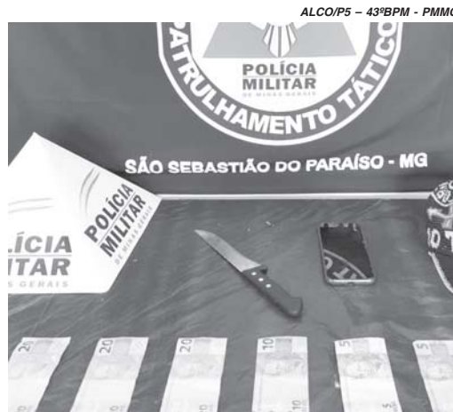
Menor assaltante e material recuperado foram apreendidos e encaminhados à delegacia

A Polícia Militar foi acionada para atender a ocorrência nas imediações do bairro Parque Belvedere. No local, segundo informações do funcionário, chegou um adolescente munido com uma faca de cozinha e anunciou o assalto. Fez ameaça e exigiu lhe fosse pas-