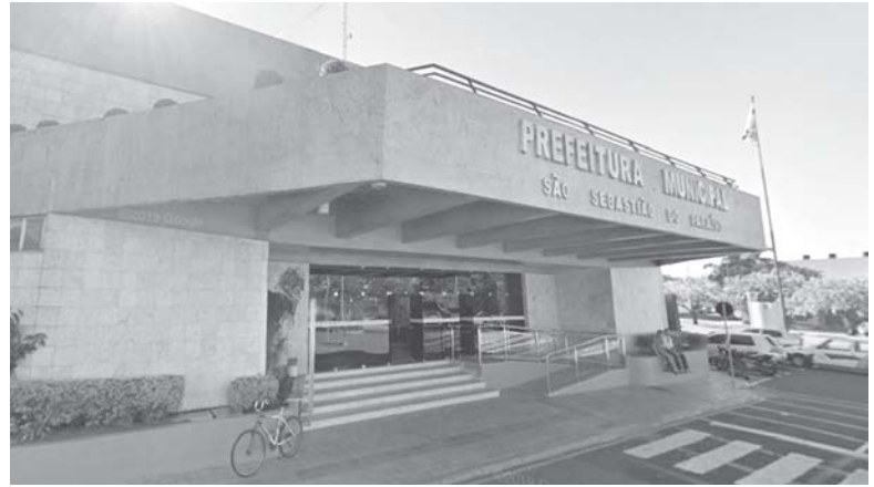
Projetos prevêem mudanças na estrutura administrativa da Prefeitura de Paraíso entre outras medidas

Também conta a atuação no relacionamento com o Poder Legislativo, acompanhamento da divulgação de atividades da Prefeitura, atendimento aos representantes da imprensa, além de acompanhar o