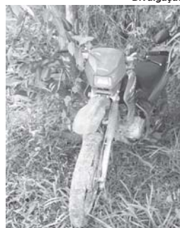
Animal abatido e veículos foram apreendidos durante ocorrência de caça ilegal na zona rural de Paraíso

Dois homens foram surpreendidos por policiais militares que integram a Patrulha Rural durante a atividade de patrulhamento no domingo, 7, na região da Lagoa Preta em São Sebastião do Paraíso. No local foram encontrados materiais utilizados para a prática da caça e havia um animal abatido. Os suspeitos fugiram por uma mata e deixaram para trás dois veículos, aparelho celular e documentos que permitiram que fossem identificados. O caso foi encaminhado para investigação da Polícia Civil.