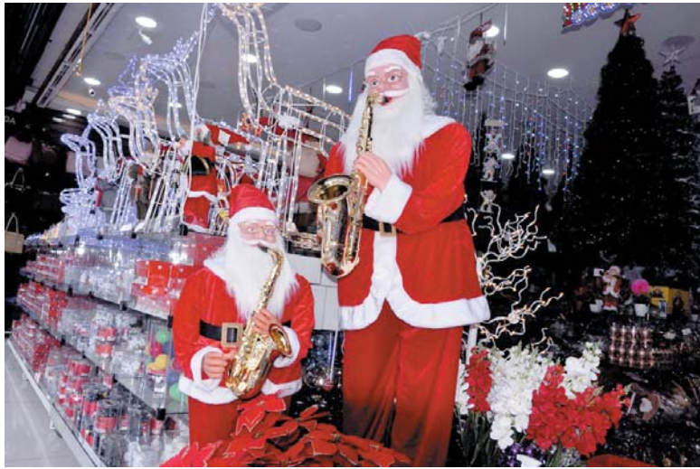
Clima natalino já está presente nas vitrines de vários estabelecimentos comerciais de Paraíso