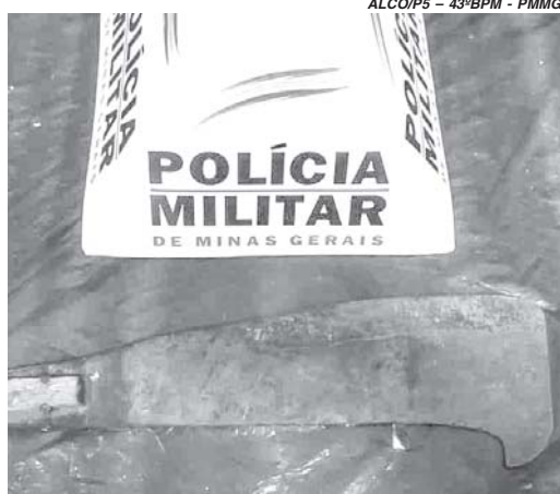
Podão utilizado durante as agressões no pai e no irmão foi apreendido pela Polícia Militar

A Polícia Militar foi acionada na noite de segunda-feira, 8, em São Sebastião do Paraíso para uma ocorrência de agressão envolvendo familiares no bairro São Sebastião. Em uma residência os policiais depararam com um idoso de 60 anos que informou ter sido agredido pelo filho de 30 anos, que durante discussão teria atingido até mesmo um irmão menor. O suspeito foi localizado e preso sendo encaminhado à delegacia da Polícia Civil. As vítimas foram encaminhadas para atendimento médico. Conforme informações obtidas pela reportagem, o acusado pelas agressões teria passado todo o dia de segunda-feira fazendo o consumo de drogas e bebidas alcoólicas. Em dado momento, o rapaz de 30 anos teria se desentendido com o irmão menor, de 16 anos. De posse de um podão o agressor