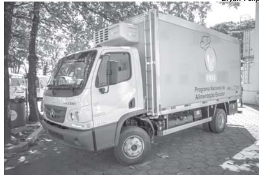
O valor investido no veículo foi de R$ 244 mil

A Prefeitura de São Sebastião do Paraíso adquiriu com recursos próprios um moderno caminhão refrigerado que será destinado para a distribuição da merenda escolar no município. O valor investido foi de R$ 244 mil, e o veículo ajudará a dinamizar ainda mais a distribuição dos alimentos.