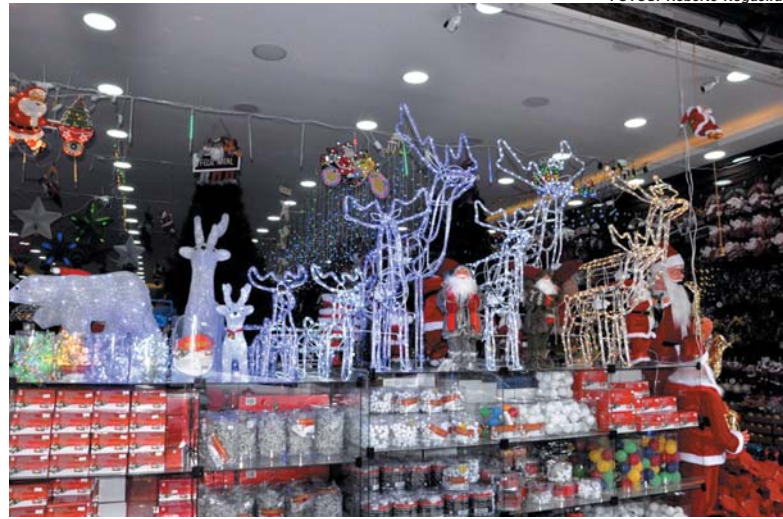
Em várias lojas do comércio no centro da cidade já é possível se deparar com as luzes e cores do Natal

Já é Natal em alguns estabelecimentos comerciais do centro de São Sebastião do Paraíso. Faltando cerca de 45 dias para a celebração de uma das datas mais importantes do ano, já é possível deparar com várias lojas onde o clima natalino já se faz presente nas vitrines.