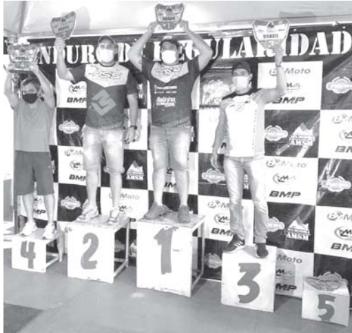
No final de semana os pilotos paraisenses competiram na Copa Sul Mineira com sede em Piumhi

Pilotos da ATP (Associação dos Trilheiros Paraisense) mais uma vez fizeram bonito e se destacaram em mais uma competição da temporada. Neste final de semana participaram da 5ª Etapa da Copa Sul Mineira de Enduro de Regularidade. A competição foi realizada abrangendo áreas dos municípios de Luminárias, Lavras, Lambari, Baependi e Piumhi.