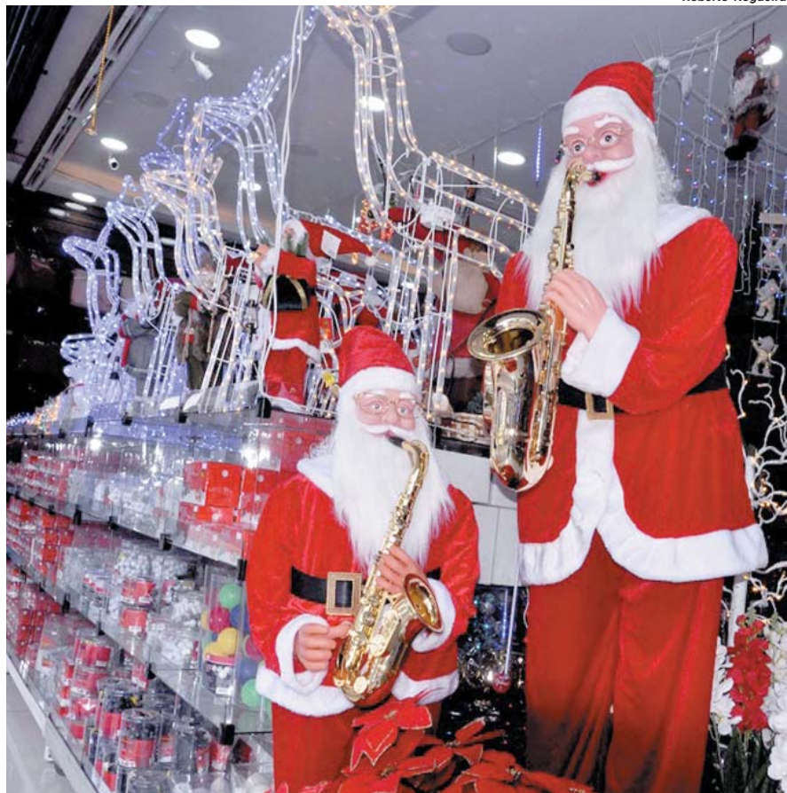
Clima natalino já está presente nas vitrines de vários estabelecimentos comerciais de Paraíso