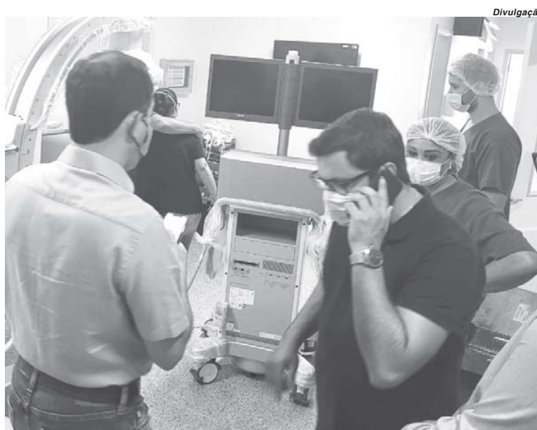
Recursos recebidos pela Santa Casa serão destinados a aquisição de equipamento

co é prioridade em nossos mandatos e contamos com a sua participação para divulgar a iniciativa e nos ajudar a chegar mais longe”, escreveu o depu-