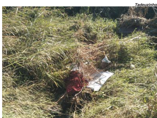
Área verde de propriedade da Prefeitura, está suja de detritos e matagal que faz esconder o curso do córrego Coolapa e se tornou criadouro de insetos e bichos peçonhentos

As justas reclamações se referem a matagal, lixo, galhos secos de cortes de árvores e outros detritos que podem acumular água de chuva e virar ou até