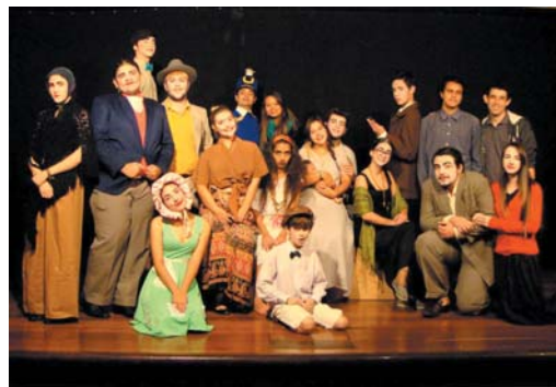
Memórias de Um Sargento de Milícias, 2016, direção de Lucas Logan e Katia Mumić