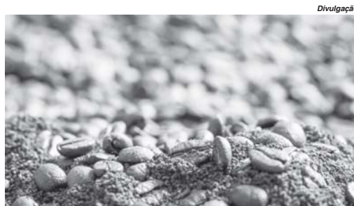
Campanha destaca conceito do respeito ao tempo onde a vida ganha um sabor especial

"Nossa campanha faz esse convite de entrada no mundo dos cafés especiais e vai ao encontro da percepção das pessoas: descobrimos que, ao contrário de quem toma café tradicional, que normalmente busca estímulo e energia, quem escolhe o café especial quer aproveitar o momento para desconectar, cuidar de si, relaxar e se inspirar. Existe esse respeito ao tempo de cada eta-