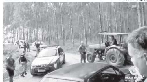
Ação conjunta da PM paulista e mineira obtendo sucesso com a recuperação de produtos roubados na zona rural na região da divisa

Uma ação conjunta da Polícia Militar de Minas Gerais e de São Paulo resultou na prisão de quatro homens suspeitos no envolvimento do furto de dois tratores, que foram recuperados, em uma propriedade rural na divisa entre os dois estados.