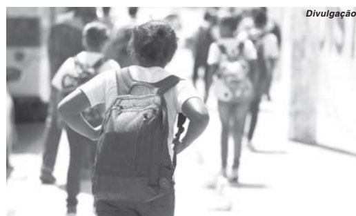
Responsáveis pelas escolas poderão conferir informações no Sistema Educacenso e fazer correções se for necessário

Durante o período de um mês, as escolas terão a oportu-