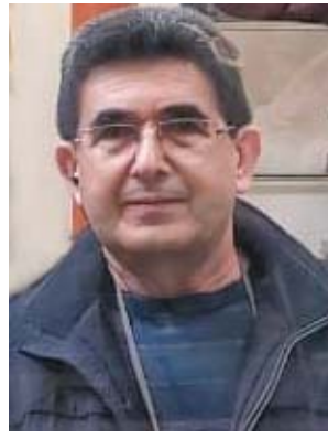
14/10 Fotógrafo - Empresário Antonio Vicente Silva