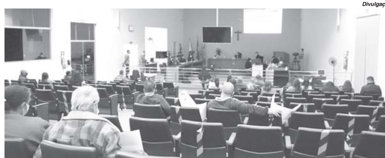
Municipalização do ensino teve audiência pública e foi aprovada na Câmara de Paraíso em julho deste ano

O edital da UEMG foi divulgado em 13 de agosto. A participação de servidores da SEE/MG está regulamentada pela Resolução SEE nº 4.600/2021, que estabelece critérios para a inscrição e matrícula do servidor estadual. As vagas ofertadas pela UEMG são destinadas aos Professores de Educação Básica (PEB) / Anos Iniciais do Ensino Fundamental da secretaria estadual, que estejam no exercício de Regência de Turma ou atuando como Professor Eventual ou no Ensino de Uso de Biblioteca, em escola estadual de anos iniciais do ensino fundamental, inserida no Projeto Mãos Dadas.