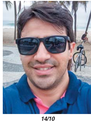
14/10 Contador - Consultoria Fiscal IDR Soluções Diego Melo