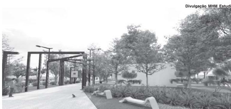
Parque do Bicentenário já ganhou projeto visual e recebeu apoio do Executivo para se tornar real

Eles apontam que este é mais um passo dado para um futuro melhor sustentável para