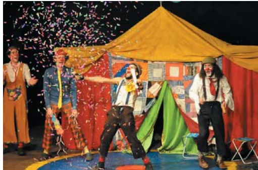
Nova lei prevê ações emergenciais de apoio a artistas durante a pandemia

Cinco projetos de lei aprovados pelo Plenário da Assembleia Legislativa de Minas Gerais (ALMG) no mês passado foram sancionados pelo governador Romeu Zema. A promulgação das leis foi publicada no Diário Oficial Minas Gerais desta sexta-feira (5/6). Uma delas prevê que o poder público tenha ações emergenciais voltadas para o setor cultural durante a pandemia de Covid-19.