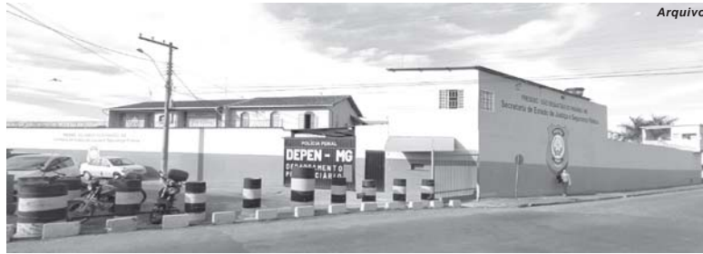
Homem recapturado havia fugido do presídio de Paraíso há quase 16 meses

Ainda de acordo com a polícia o homem preso é considerado pessoa perigosa e com passagens em várias cidades da região. Ele cumpria pena por ter sido condenado a mais de oito anos de reclusão pelos crimes de roubo e furto. Junto com ele foi preso um homem que também passa a ser investigado para