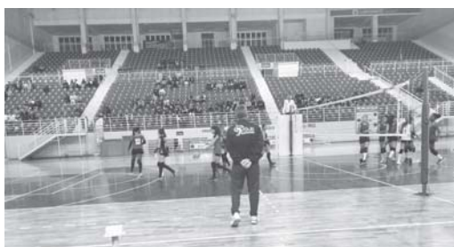
Meninas de Paraíso vencem Uberaba pela segunda vez e seguem invictas no campeonato