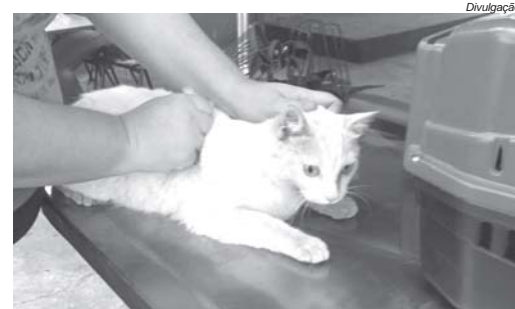
Objetivo é identificar animais em caso de fuga ou abandono

A primeira ação do Programa ocorreu no início do mês no canil municipal, quando foram microchipados 39 cães. A próxima ação prevista deverá abranger animais em abrigos. Em seguida deverá ser realizado um mutirão, ainda com data e local a serem definidos.