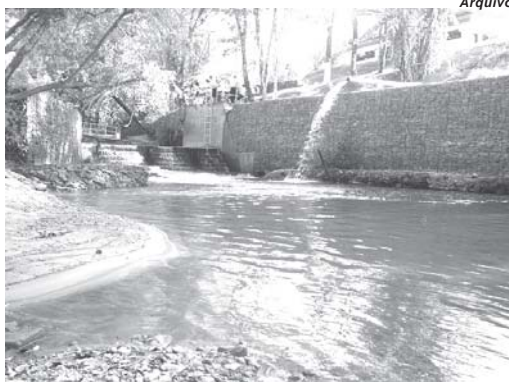
Projeto propõe mudanças na legislação para ampliar áreas protegidas as margens dos mananciais do município

Em relação ao Sistema de Esgotamento Sanitário da Sede Municipal é proposto que os novos empreendimentos que queiram se instalar na área vizinha, com raio inferior a 500 m de distância das estações elevatórias e de tratamento de esgoto, devem apresentar Es-