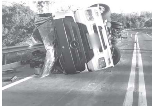
Caminhão ficou danificado e parte da carga caída as margens da rodovia

Após os primeiros socorros a vítima foi encaminhada para atendimento na Santa Casa de Misericórdia em Paraíso, onde