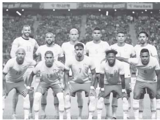
Por Agência Brasil Rio de Janeiro

Jogos preparatórios para Copa do Catar serão nos dias 23 e 27