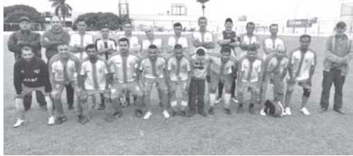
As equipes do Mocoquinha e TNB venceram suas respectivas partidas e folgam na próxima rodada