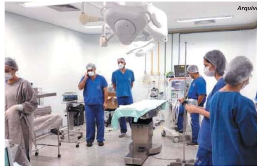
Há um ano Santa Casa realizou com sucesso primeira neurocirurgia

O comunicado conclui afirmando que investimentos assim, ocasionam melhores atendimentos e desfechos para a população de Paraíso e toda microrregião assistida pelo hospital.