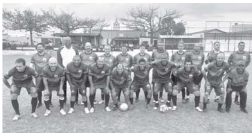
Já o Ipiranga e do CVA S.T. Aquino voltam a campo e tentam a reabilitação