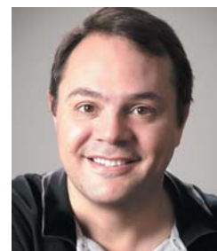
26/08 Jucelino Dias FOTÓGRAFO