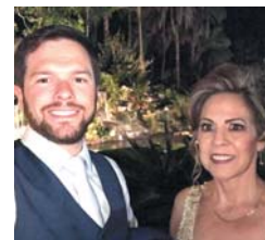
21/08 Iran Maldini DENTISTA