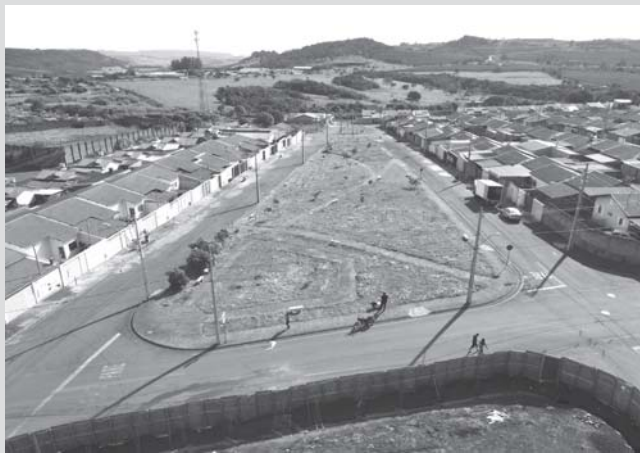
Local onde será construída a quadra do Diamantina

A propositura, ao todo, compreende um investimento de aproximadamente R$ 7.975.327,00. Para a quadra do bairro Jardim Diamantina, serão aplicados R$ 566.933,87; já a quadra do Ibrantina Amaral, o investimento somado corresponde a R$ 755.531,42. Além disso, há o investimento de R$ 899.202 mil para a aquisição de mobiliário e equipa-