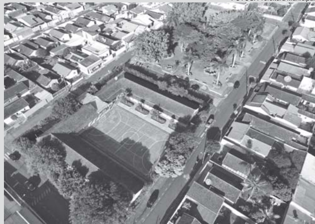
Quadra do Ibrantina será construída ao lado da Escola