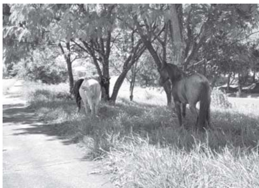
Jardim Coolapa e Novo Milênio