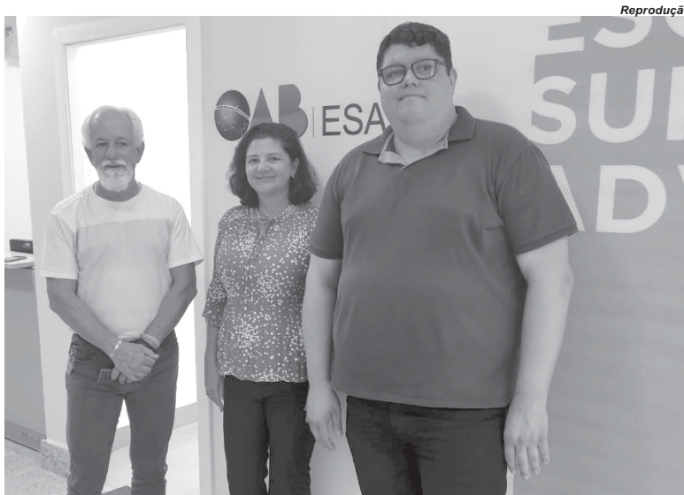
Diretoria da Libertas e Fecom na Escola Superior de Advocacia buscam novos curso através de parceria

"Essa visita contou com a intermediação do Presidente