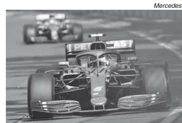
Não está descartada nova dobradinha da Mercedes na Espanha