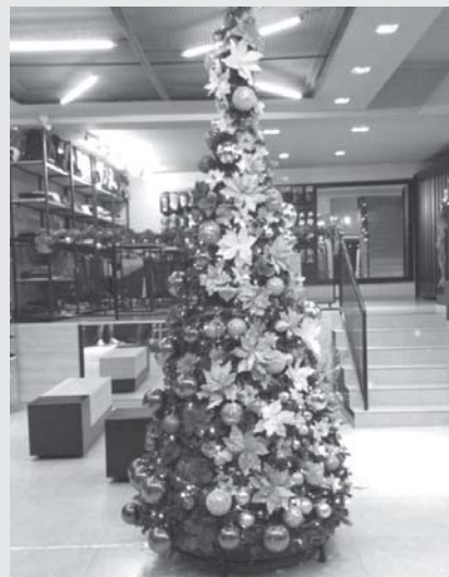
2º Lugar Vitrines - Sport Center