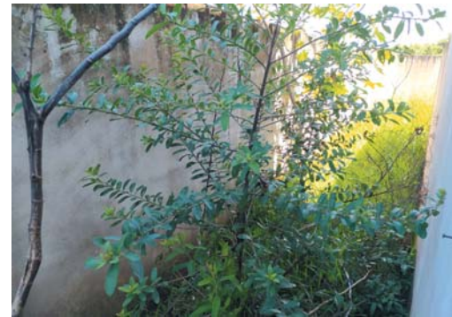
Obra de construção da UBS no Rosentina ficou paralisada por sete anos