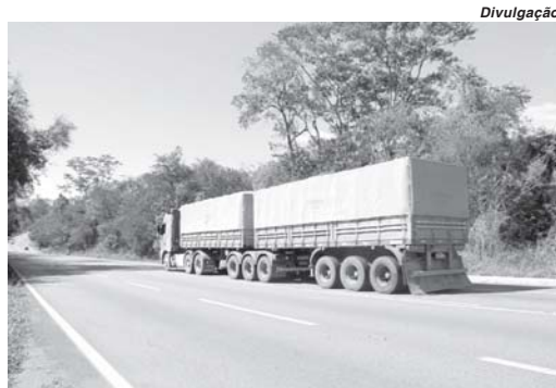
Documento é exigido nas rodovias de Minas para transporte de cargas em veículos do tipo rodotrem, bitrem e tritrem

Conforme o anunciado, todos os transportadores, representantes e interessados no transporte de cargas, nas rodovias sob responsabilidade do DER-MG, em veículos com dimensões acima dos padrões estabelecidos na resolução Contran 882/2021, precisam obter a AET para transportar cargas em veículos do tipo rodotrem, bitrem, tritrem,