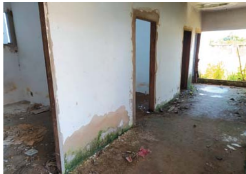
Parte das obras inacabadas permanece exposta ao tempo