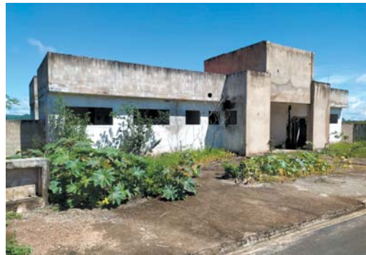
Local chegou a ser utilizado como abrigo de andarrilhos e esconderijo de usuários de drogas