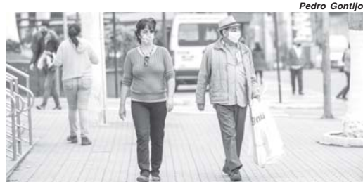
Pessoas devem manter o uso de máscara e outras medidas de proteção contra os vírus em circulação

A previsão é que quarta-feira (12/1), São Sebastião do Paraíso alcançaria a casa de 24 mil notificações desde o início da pandemia. Os mais de 500 registros da terça-feira, 11, é considerado um recorde em um só dia. Deste total 60 foram confirmados. A situação reflete diretamente na quantidade de pessoas isoladas que chega a 210 confirmados e 866 tidos como suspeitos que es-