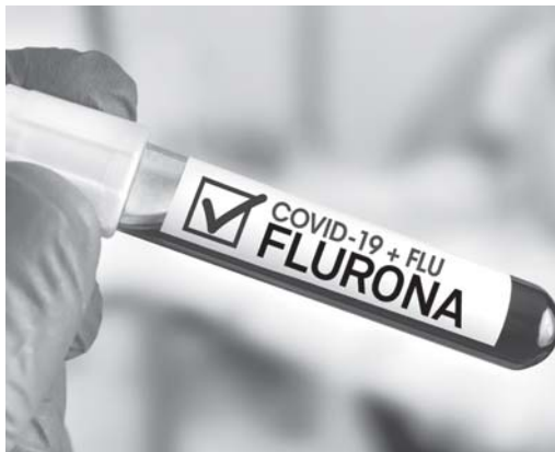
Casos de coinfeção aumentam por todo o Estado e estão sendo monitorados, inclusive em Paraíso

A Secretaria de Estado de Saúde (SES-MG) anunciou nesta semana 14 casos confirmados de "flurona" em Minas Gerais. Entre eles consta um paciente de São Sebastião do Paraíso que estava lotado na rede particular e o município rastreia como possa ter ocorrido a contaminação. De acordo com a secretaria nenhum paciente com coinfeção pelo influenza e pelo coronavírus morreu no Estado.