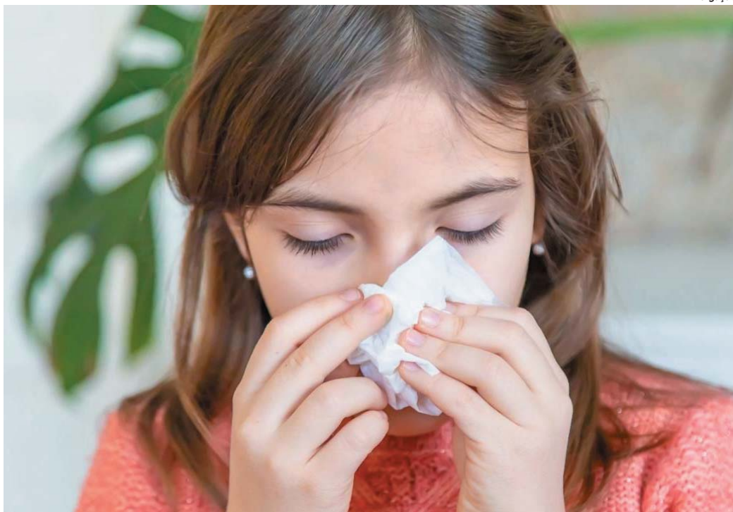
Durante a semana aumentou na cidade pessoas com sintomas gripais procurando postos de saúde