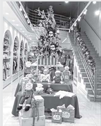
1º Lugar Vitrines - Mimos Baby Kids