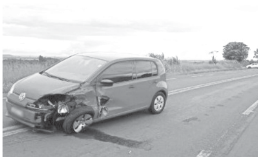
Nos dois acidentes os veículos ficaram parcialmente danificados na tarde de segunda-feira na LMG-836

Durante o atendimento um caminhoneiro que passava pelo local anunciou a ocorrência de um segundo acidente poucos quilômetros à frente na mesma rodovia. Os resgatistas, então, deslocaram por mais três quilômetros em direção a São Tomás de Aquino quando depararam com um VW Gol fora da pista. Não havia nenhuma pessoa no automóvel.