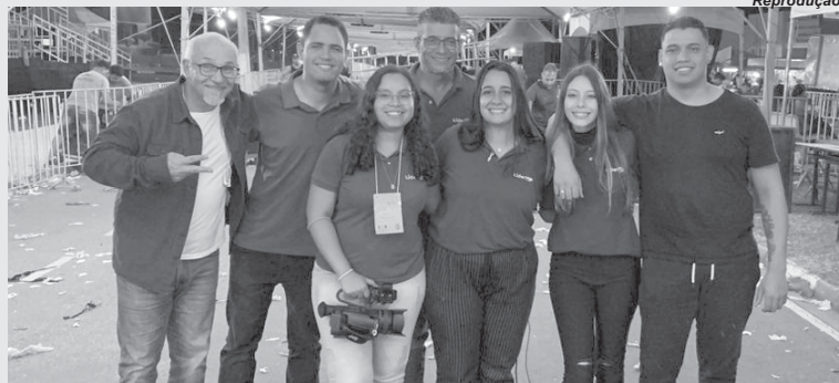
Parte da equipe envolvida na transmissão das Congadas de São Sebastião do Paraíso

Neste ano, as câmeras colocadas dentro da passa-