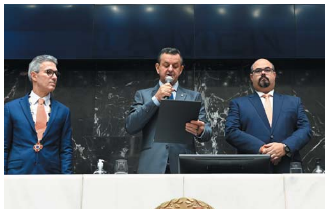
Arantes presidiu solenidade de posse do governador Romeu Zema e do vice, Mateus Simões

Arantes, cumprimentou o governador pela recondução