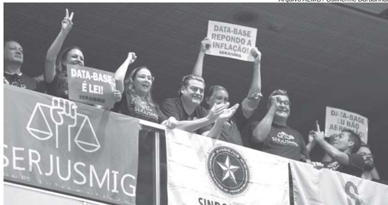
As normas sancionadas pelo governador garantem a recomposição de perdas inflacionárias dos servidores

Os servidores do Tribunal de Contas do Estado (TCE) foram beneficiados com o reajuste de 5,91%, referente ao ano de 2023, garantido pela Lei 24.265. A norma teve origem no PL 4.085/22, de autoria do próprio TCE. Já a Lei 24.267, originada no PL 4.116/22, da Mesa da Assembleia, corrige os vencimentos e proventos dos servi-