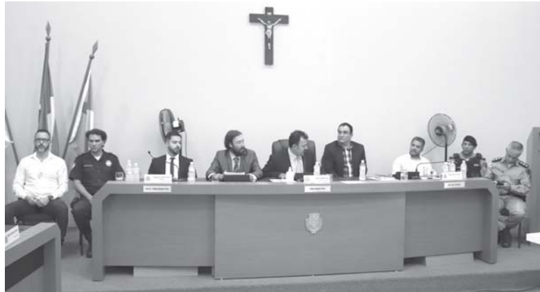
Prefeito e representantes da Guarda Municipal e polícias Militar e Civil usaram a tribuna durante a sessão da Câmara

Autoridades falam em reforço na segurança e garantem que estão monitorando informações sobre supostos ataques a escolas de Paraíso