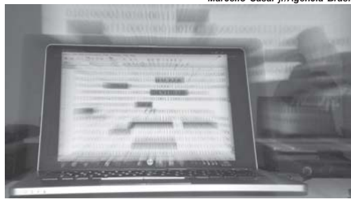
Marcello Casal Jr/Agência Brasil

Entre os delitos apontados como crimes cibernéticos es-