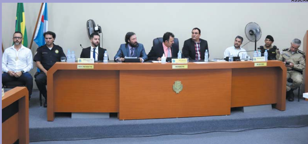
Prefeito e representantes da Guarda Municipal e polícias Militar e Civil usaram a tribuna durante a sessão da Câmara