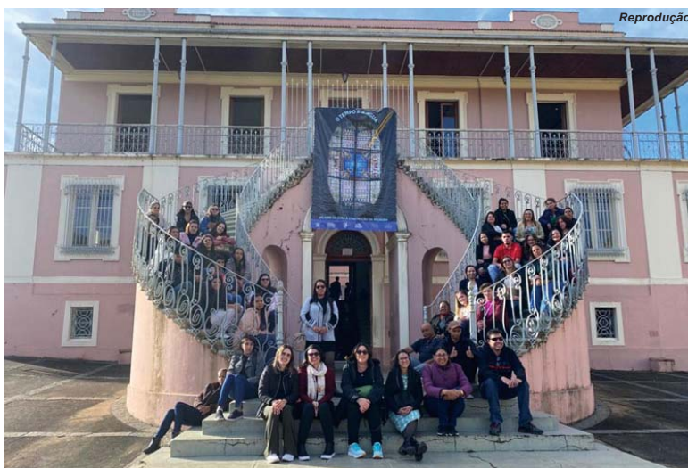
Alunos em frente ao Museu Histórico e Geográfico de Poços de Caldas