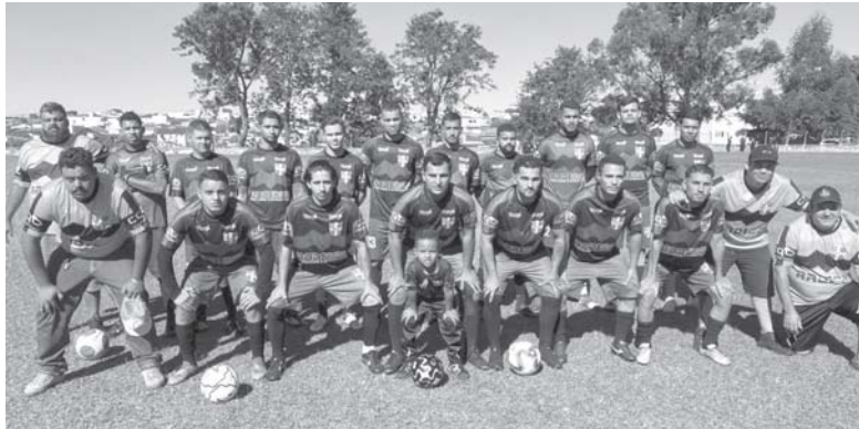
Coreia joga bem mais uma vez e segue firme na luta pela liderança do Grupo B