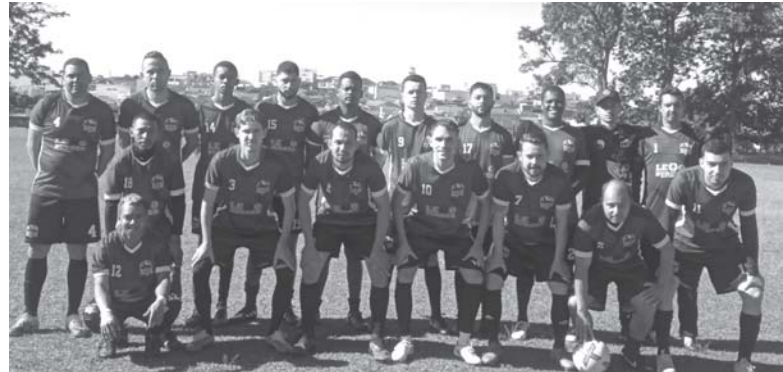
Líder, Escolinha do Rodrigo goleia o Bandeirantes por 9 a 1 na Praça de Esportes Castelo Branco

Por fim, o Parceiros e Aliados continua evoluindo na Taça Paraíso e conquistou mais três pontos importantes contra o forte time dos Mar-