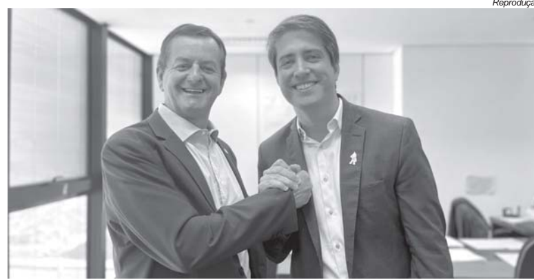
Deputado Estadual Antônio Carlos Arantes (PL) e o secretário de Estado de Saúde, Fábio Baccheretti

“Já fizemos muito pela saúde de Paraíso e região e ao lado do governador Romeu Zema vamos fazer muito mais”, afirmou o deputado Arantes.