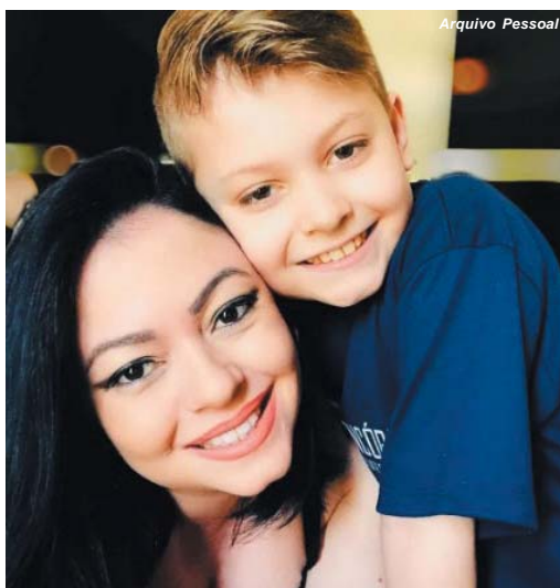
Mãe e filho autistas superam desafios do Transtorno do Espectro do Autismo

Ela complementa que no Centro Florescer são atendidas desde crianças com um ano