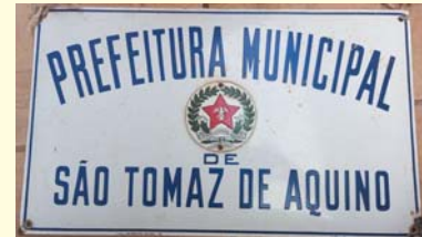
Antiga placa esmaltada de identificação da prefeitura afixada em 1935 no antigo prédio do poder executivo