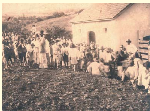
Inauguração do matadouro Municipal realizada pelo prefeito Antonio Alves de Figueiredo no final de 1925 e inaugurado no dia 02/01/1926

Após as eleições, foi marcada a data da posse dos eleitos para 13/04/1924, um dia de grande júbilo, muito comemorado por toda a população do recém-emancipado município de São Tomás de Aquino. As comemorações começaram às 5 horas da manhã com uma salva de tiros, missa às 7 horas. Depois o cortejo comemorativo partiu da cadeia