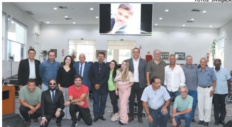
Familiares de Falladaise e jornalistas de Paraíso participaram da sessão em que PL foi aprovado pelos vereadores