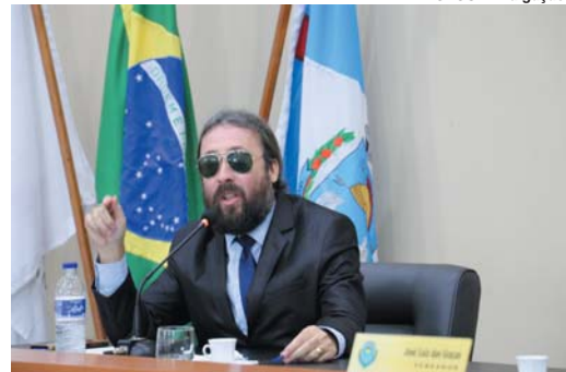
Para Biju, turismo pode gerar emprego e renda para jovens paraísenses e movimentar economia local