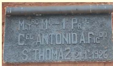
Placa de inauguração colocada sobre o umbral da porta de entrada do matadouro em 02/01/1926