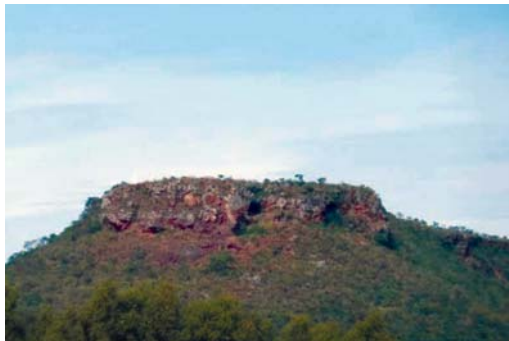
Suposta visita extraterrestre ao Morro da Mesa poderia atrair fãs de ufologia para o distrito de Guardinha