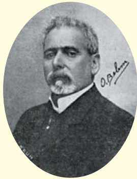
A lei que deixava São Tomás como distrito, foi assinada pelo apresidente da época Júlio Bueno Brandão (1859 -1931)

pois a primeira vez que São Tomás pleiteou sua emancipação política ocorreu no ano de 1911, no primeiro de-cênio, quando da reforma administrativa do Estado de Minas Gerais. Naquele ano, São Tomás e outros distritos buscaram a emancipação política.