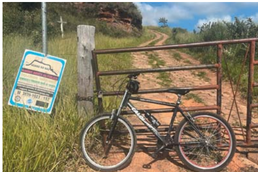
Vereador defende que Morro do Baú fique aberto para que pessoas contemplem o nascer e o pôr do sol no mirante

Morros da Mesa e do Baú, além do Parque da Serrinha e da Arena Olímpica são citados pelo vereador como pontos que merecem estudo e investimento