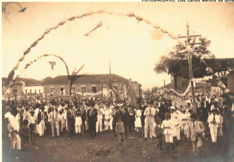
Trecho do Rua Alves de Figueiredo em frente à igreja mátria. Passeada comemorativa para a posse do Prefeito e vereadores em São Tomás de Aquino em 13/04/1924