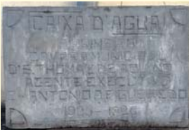
Pedra inaugural da primeira Caixa D'água em 1926