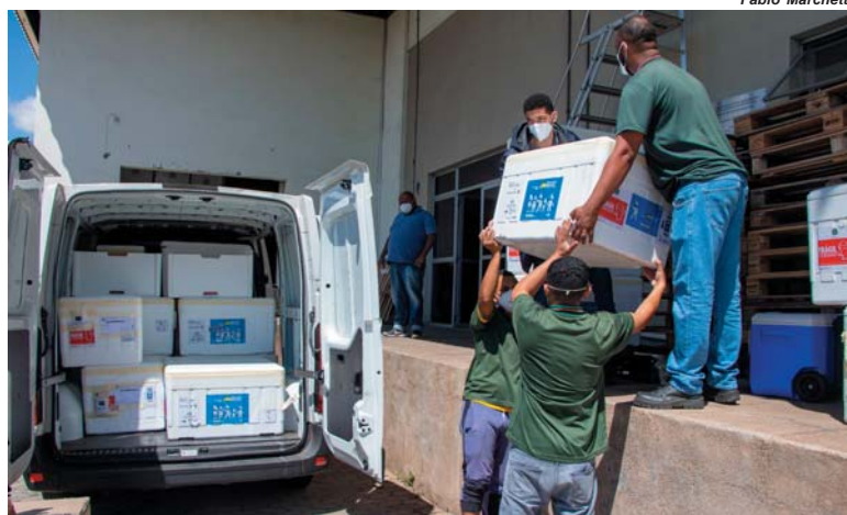
Doses das vacinas destinadas a crianças a partir de cinco anos começam a ser distribuídas aos municípios

A Secretaria de Estado de Saúde de Minas Gerais (SES-MG) começou a distribuir, na tarde de sexta-feira, 14, as 110 mil doses de vacina contra a covid-19 da Pfizer. Este é o 78º lote entregue pelo Ministério da Saúde ao estado e se destina à administração de primeira dose (D1) em 5,91% de crianças de 5 a 11 anos de idade. A previsão é de que para a microrregião serão encaminhadas 630 doses, sendo que a estimativa para São Sebastião do Paraíso são 360 doses.