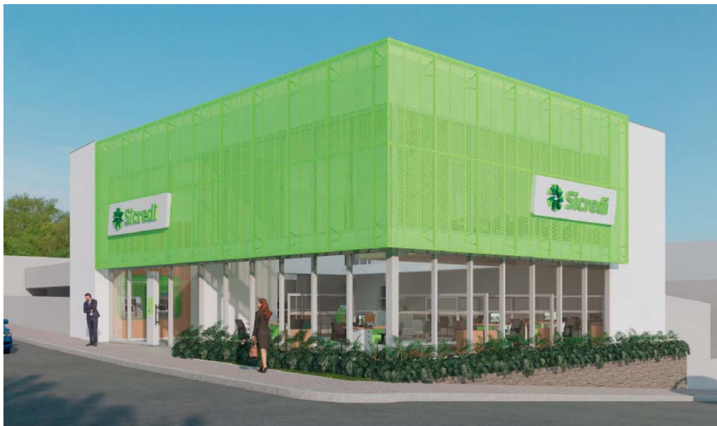
Projeto da agência do Sicredi em Nova Resende

Conforme explica o presidente da Sicredi das Culturas RS/MG, "O Sicredi é um sistema nacional, que atua localmente por meio de mais de 100 cooperativas. A Sicredi das Culturas RS/MG é uma delas, e é responsável pela expansão aqui na região, com um objetivo muito claro: colaborar com o desenvolvi-