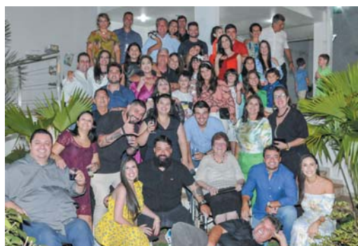
Família Brigagão Alcântara