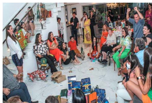
Natal da Família Brigagão Alcântara