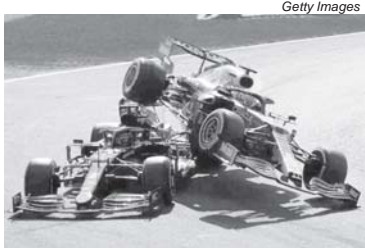
GP da Itália foi eleito o melhor do ano pelos fãs da F1

O GP de São Paulo ficou em 3º (???) com 10% dos votos. Na minha anotação, escrevi épico! Pra quem não se lembra, Hamilton largou da última posição na sprint race (mini corrida do sábado) e terminou em 5º. Sofreu outra punição de cinco posições no grid pela troca de motor e largou de 10º para vencer a corrida depois de um duelo espetacular com