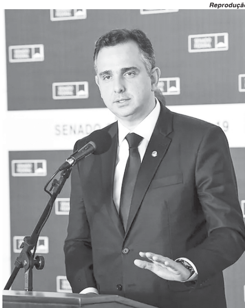
Presidente do Senado, Rodrigo Pacheco

E isso é algo que nos converge absolutamente, de que todos nós estamos prontos para reagir a arroubos, bravatas e ações que, definitivamente, não calham no Estado Democrático de Direito", disse Rodrigo Pacheco