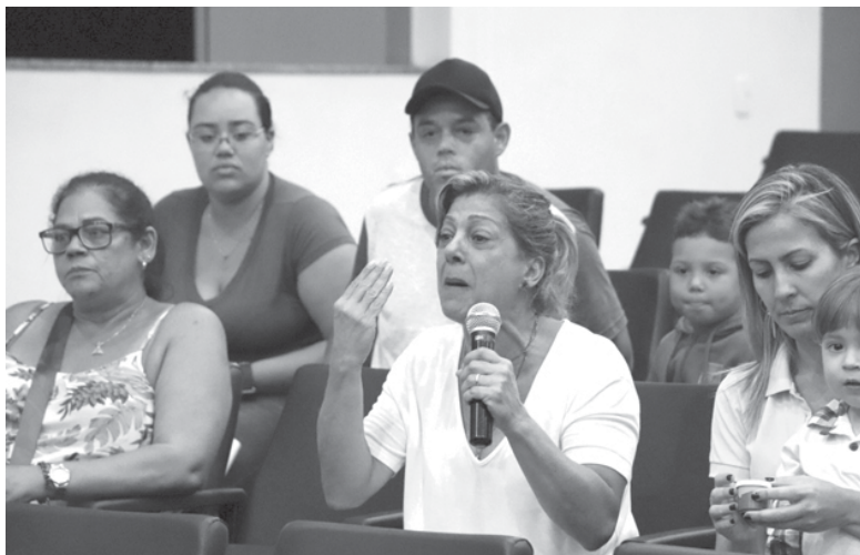
Mãe chorou ao questionar o que irá fazer e pediu providências em sessão da Câmara