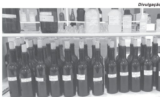
Pesquisa avalia uso de madeiras brasileiras para envelhecimento de vinho, inclusive com uva produzida em Paraíso