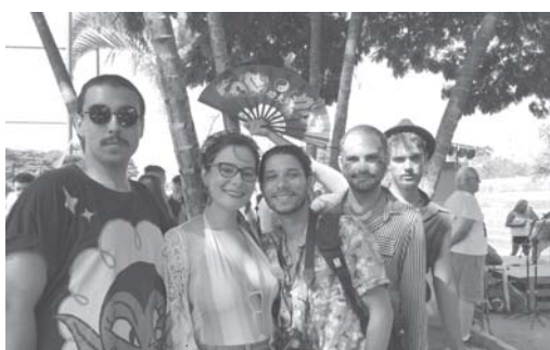
Grupo que fortaleceu movimento LGBTQI+ em Paraíso e pretende organizar nova luta em 2020