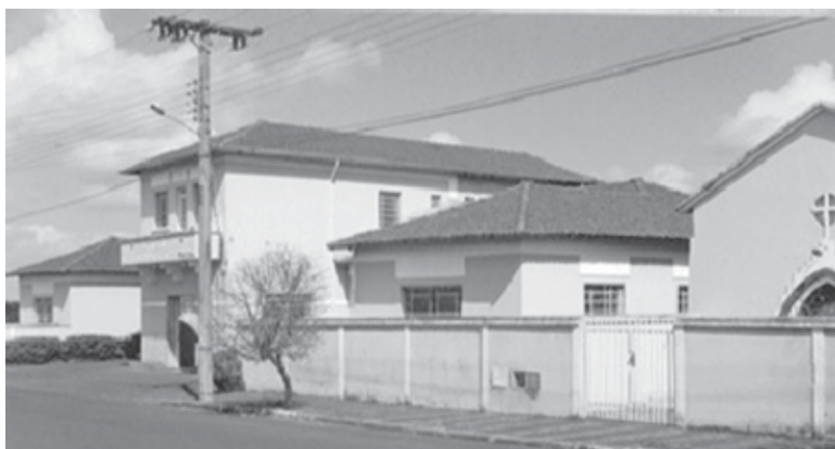
Hospital Nossa Senhora do Sagrado Coração