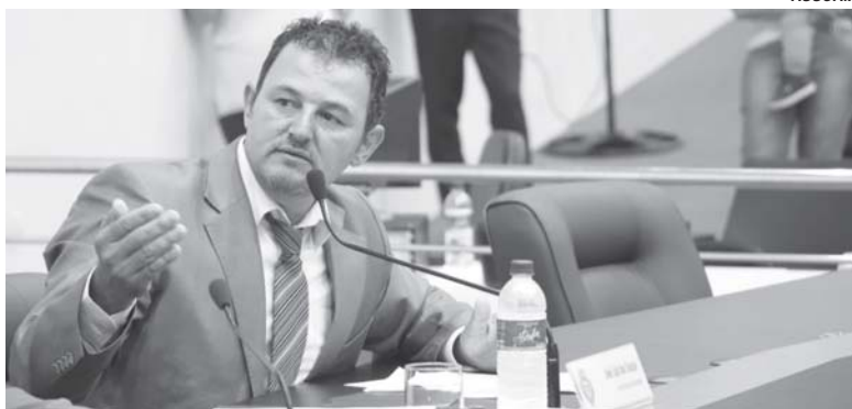
Vereador quer maior segurança para áreas de lazer com opções aquáticas

De acordo com o projeto, estabelecimentos que te-