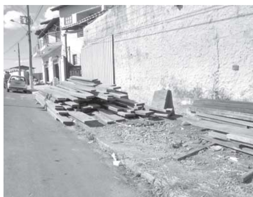
Preocupados com a acessibilidade e acidentes, pedestres reclamam de depósito irregular de materiais em cima de calçada na Av. Florentino Cândido de Rezende, no Alto Bela Vista