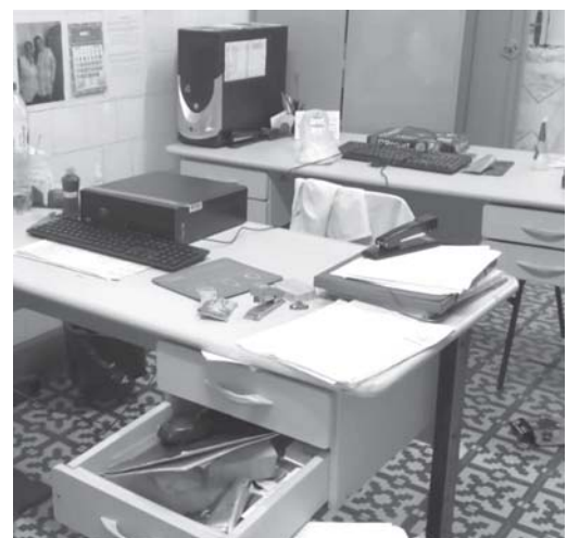
Computadores utilizados pela equipe do local foram levados pelos invasores

Suspeito foi identificado e é procurado pela polícia. Prefeito promete aumentar a vigilância na cidade