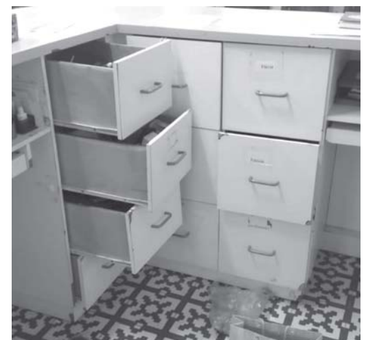
Gavetas onde estavam documentos de pacientes e outros objetos foram reviradas