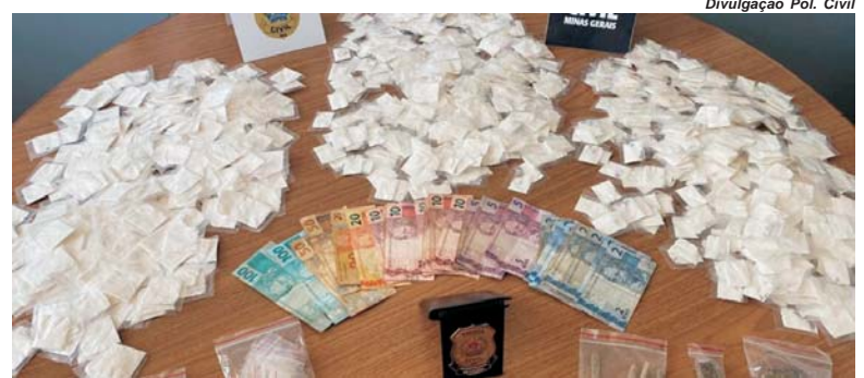
Divulgação Pol. Civil

COM INFORMAÇÕES DA ASS. DE IMPRENSA DA POLÍCIA CIVIL MG