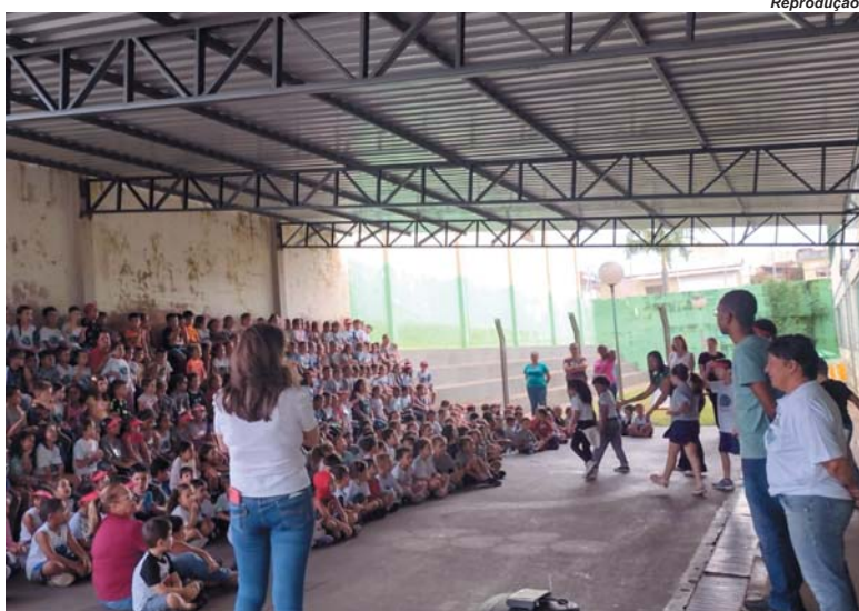
Nesta semana, equipe da Vigilância em Saúde realizou uma série de palestras de conscientização para alunos do município

Diante do fato, a prefeitura realizou, nesta semana, uma força-tarefa em parceria com a Vigilância Sanitária, a Guarda Municipal e o 2º Pelotão do Corpo de Bombeiros para passar um "pente fino" nas regiões com mais casos registrados até agora. "Para combater a dengue, estamos trabalhando praticamente de domingo a domingo, realizando mutirões todos os finais de