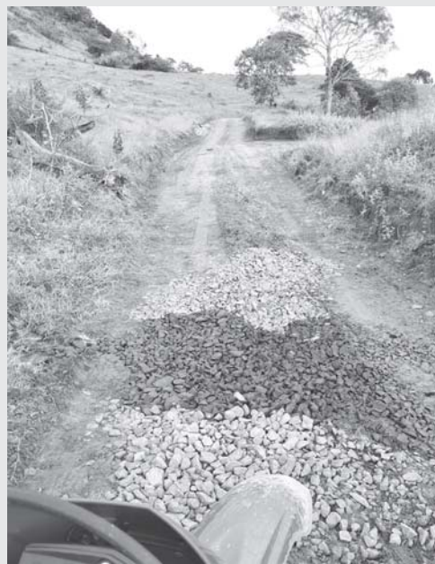
Em atendimento às reivindicações de Moradores da região do Morro Vermelho, região mais alta, depois do local conhecido como "tembé", a Secretaria Municipal de Obras procedeu nesta semana reparos na estrada que recebeu cascalhamento em alguns trechos, e conserto em mata-burro.