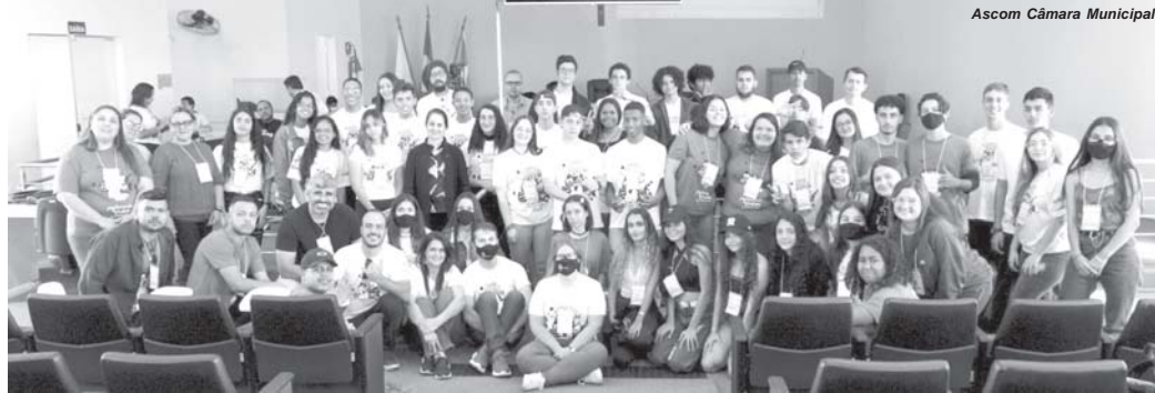
Participantes da Elegis em 2022 definiram o tema a ser debatido pelos novos alunos: "Jovem e o Mercado de Trabalho"

Para atrair os jovens de Paraíso para o projeto, a equipe da Escola do Legislativo realizou mobilizações nas escolas, colocou cartazes em locais com grande circulação de pessoas e divulgou as inscrições nas redes sociais da instituição. As inscrições para o Parlamento Jovem são abertas para alu-