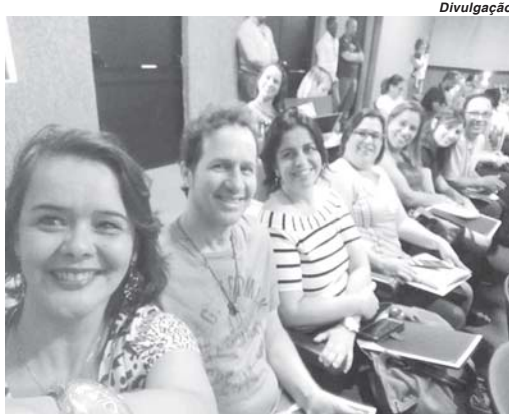
Modalidade de ensino da rede estadual conta com cerca de 180 mil alunos jovens e adultos

Muitos alunos que estavam no ensino regular encontraram na EJA Novos Rumos possibilidades para ingressar no mercado de trabalho. Alunos maiores de 18 anos que ainda levariam uns dois anos para se formar, com a campanha e ao ver a oportunidade de concluir o ensino médio em menos tempo, este estudante optou pela EJA. Também há casos de alunos que, ao ingressar na mo-