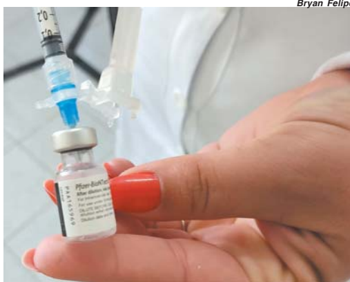
Vacinação atendeu professores e integrantes dos grupos prioritários nas últimas semanas