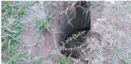
Enorme buraco sem tampa em uma caixa de esgoto que pode provocar acidentes com pessoas e animais, as margens da canalização do Córrego Coolapa, próximo da rua Tabajara Pedroso, no Jardim Coolapa

Neste final de semana o "JS" foi ao local, e registrou em foto. Moradores reclamam e esperam providências da Copasa, Vigilância Sanitária e Prefeitura, para sanar essas inconcebíveis irregularidades que podem sim afetar a saúde e segurança física dos moradores e transeuntes.