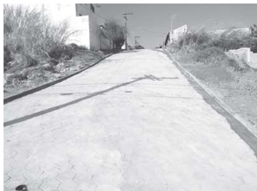
Prefeitura refez o calçamento na Rua Paulo Alcântara, na Vila Sta. Maria, que estava danificado há mais de uma década