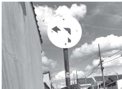
Placa de sinalização de trânsito corroida pelo tempo, indica sentido de direção errado, tem que ser corrigido

Alcântara tem sentido único ou mão única para trânsito de veículos para quem dirige sentido até chegar na Praça de