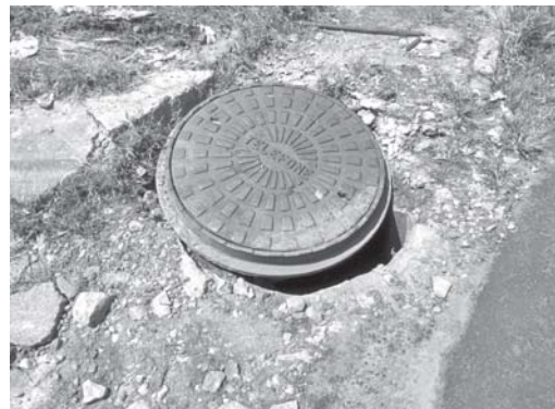
Tampa de caixa de fiação telefônica que está solta, pode provocar acidentes

Preocupados, pedestres procuraram o JS para alertar a Secretaria Municipal de Trânsito Transporte e Segurança, para que tome devidas providências sobre tampa de ferro de uma caixa de fios subterrâneo de te-