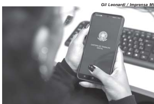
Gil Leonardi / Imprensa MG

Por atividade econômica, o setor de serviços liderou a geração de empregos em outubro deste ano, com a criação de 6.887 postos de trabalho. Em seguida, vieram o comércio (3.917 empregos) e a indústria