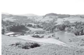
PROJETO COMPOSTAGEM SANTA CATARINA