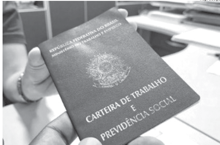
Pelo terceiro mês consecutivo Paraíso patina na geração de empregos e apresenta saldo negativo

Ainda em relação ao perfil das pessoas admitidas em