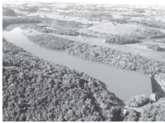
PROJETO BT GERADORA

O Sicredi – instituição financeira cooperativa com mais de 6 milhões de associados e atuação em todas as regiões do Brasil – avança em sua estratégia de Gestão de Emissões e Mudanças Climáticas. Por meio do apoio a seis projetos de créditos de carbono localizados em diferentes regiões do Brasil, neutralizou mais de 45 mil toneladas de carbono, relativas às emissões calculadas em seu Inventário de Emissões de 2021 e projetadas para todo o ano de 2022.