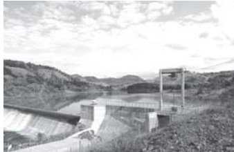
PROJETO PCH ITAGUAÇU