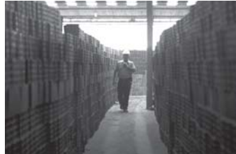
PROJETO BUENOS AIRES

Instituição projetou suas emissões até o final deste ano e, por meio de apoio a seis projetos de créditos de carbono de Norte a Sul do país, neutralizou mais de 45 mil toneladas de carbono