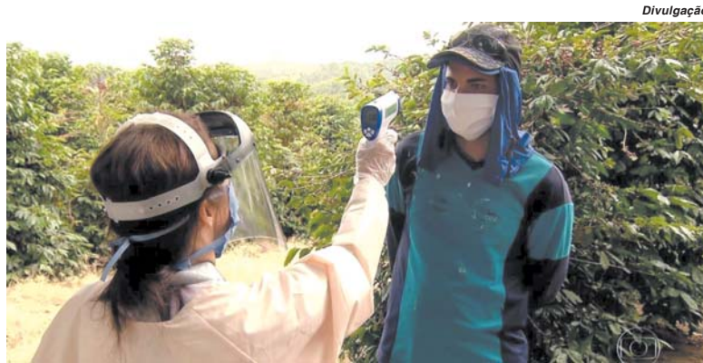
Cartilha apresenta dicas de segurança para trabalhadores durante colheita de café na pandemia

Para facilitar e reforçar a campanha foram criados dois vídeos, com informações emanadas do Ministério da Saúde e da Secretaria de Estado de Saúde de Minas Gerais. As recomendações vão desde a higiene pessoal e dos materiais utilizados, até normas de transporte das pessoas para as lavouras. A ideia central é de fortalecer a conscientização sobre os padrões sanitários adequados para segurança dos cafei-