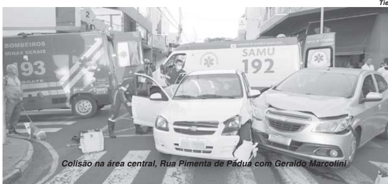
Colisão na área central, Rua Pimenta de Pádua com Avenida Marcolini

Foram acionados para atendimento a duas senhoras que estavam no interior do Celta, que descia a rua Pimenta. As vítimas, com ferimentos leves, uma na unidade de resgate dos Bombeiros, outra no suporte