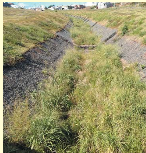
Canalização de água pluvial no Jardim Mediterrâneo está necessitando de maiores cuidados