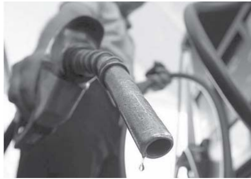
Reajustes anunciados pela Petrobrás, reduzindo os preços do litro da gasolina e do diesel não estão sendo repassados na íntegra aos consumidores paraenses

Em 25 de março a Petrobrás novamente anunciou redução de preços de R$0.11 centavos no litro da gasolina e também no diesel. Novamente nesta sexta, 9 de abril, o JS efetuou outro levantamento e constatamos que alguns redu-