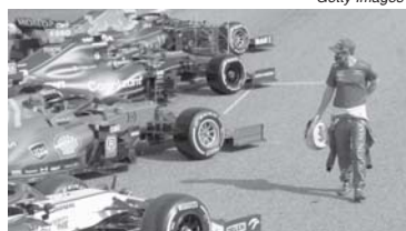
F1 diz ter planos A, B, C e D para realizar os 23 GPs do calendário deste ano

Uma coisa é certa: A Liberty fará tudo que estiver ao alcance para recuperar o prejuízo de 41% da receita arrecadada no ano passado