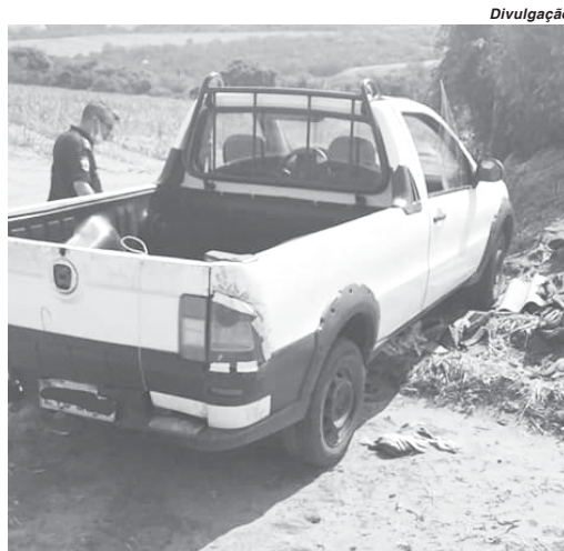
Veículo foi localizado numa estrada rural no município de Paraíso

A ocorrência foi registrada depois que um Guarda Municipal que estava de folga teria visto o veículo em uma estrada vicinal que dá acesso ao Condomínio Cachoeira, zona rural de Paraíso. Ele estranhou a presença da pick up parada no local e acionou a GCM, para a situação suspeita. Ao chega-