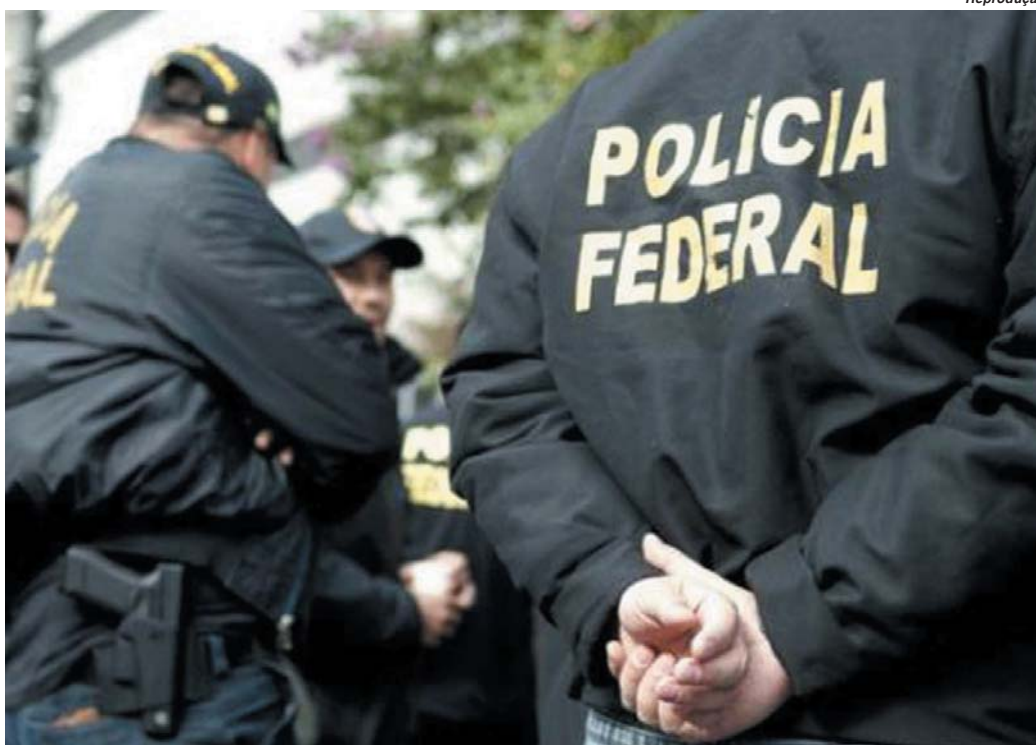
Ação da Polícia Federal mobilizou mais de 800 policiais para cumprir cerca de 500 mandados