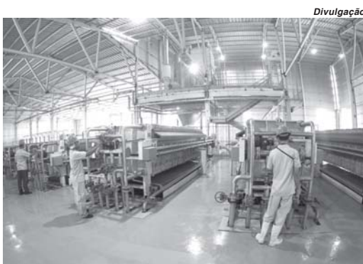
Setor industrial ajudou o município a manter saldo positivo na geração de empregos em agosto

Conforme os dados divulgados, o Brasil registrou um saldo de 372.265 novos trabalhadores contratados com carteira assinada em agosto de 2021. O saldo é o resultado de um total de 1.810.434 admissões e 1.438.169 desligamentos. De acordo com o Cadastro Geral de Empregados e Desempregados (Novo Caged), divulgado pelo Ministério do Trabalho, o salário médio de admissão caiu 1,42% na comparação com o mês anterior, ficando em R$ 1.792,07.