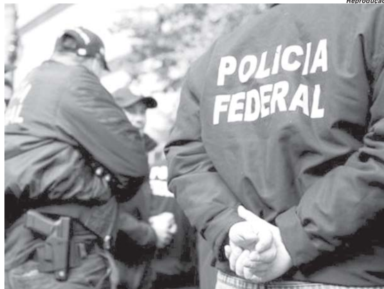
Ação da Polícia Federal mobilizou mais de 800 policiais para cumprir cerca de 500 mandados

Os investigados utilizavam veículos especialmente preparados para o transporte das armas, com emprego de batedores durante os seus deslocamentos. Para dissimular a origem criminosa do patrimônio acumulado, a organização utilizava um sofisticado esquema de lavagem de dinheiro,