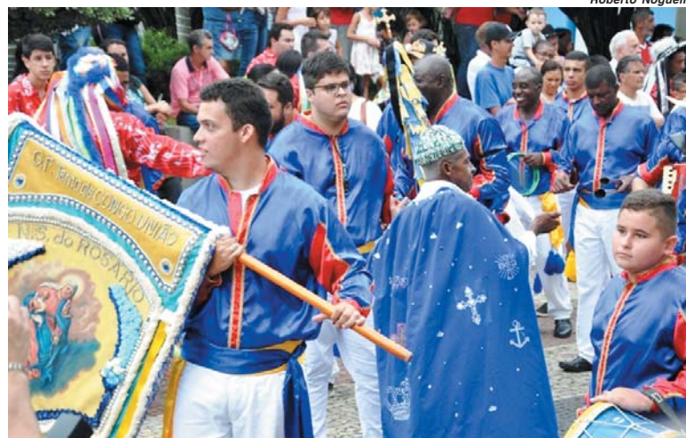
Projeto pré-selecionado da E.E. Ana Cândida aborda aspectos como a cultura negra da Congada de Paraíso

A Secretaria de Estado de Educação de Minas Gerais (SEE/MG) divulgou, na segunda-feira (4/10), o resultado preliminar da seleção de projetos de pesquisa das escolas que integrarão o Projeto de Iniciação Científica na Educação Básica, conforme Edital N° 09/2021.