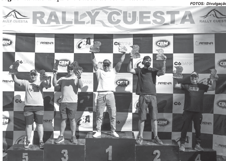
Além da vitória nas motos, Rossi também foi o mais rápido entre os pilotos de todas as categorias

“Foi uma prova muito rápida e prazerosa de se pilotar. O terreno estava úmido, porque havia chovido, então estava muito gostoso. Conseguimos