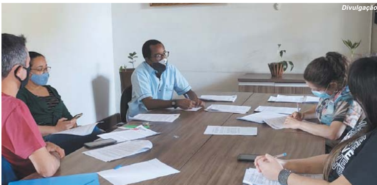
Integrantes da Gerência de Cultura debatem regras para aplicação dos recursos remanescentes da Lei Aldir Blanc

Na reunião desta quinta-feira, 23, o assunto foi novamente debatido. Ficou definido que serão três editais para contemplar mestres de cultura (abrangendo até 15 propostas que receberão R$ 4 mil cada), pessoas jurídicas com ou sem fins lucrativos (disponibilizados para até 7 propostas que rece-