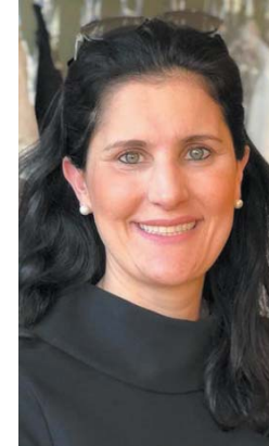
27/09 Ana Paula Pessoni - Fotógrafa