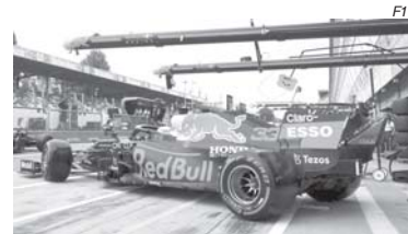
Max Verstappen trocou de motor e terá que largar do fundo do grid

O circuito foi erguido no estacionamento de um complexo construído para os Jogos de Inverno de 2014 - e aqui não resisti à coceirinha