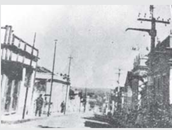
Rua Pimenta de Pádua, vê-se à esquerda o antigo Correio, posteriormente a loja de Argemiro de Pádua, hoje loja de brinquedos.