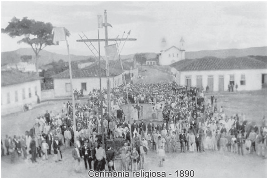
Cerimônia religiosa - 1890