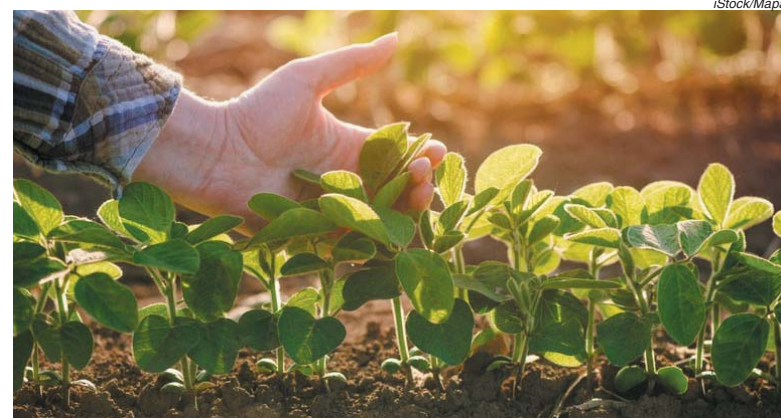
Montante supera marca de 2014, quando foram registrados 9,9 milhões de hectares segurados

Até outubro deste ano, 10 milhões de hectares foram segurados com o apoio do Programa de Subvenção ao Prêmio do Seguro Rural (PSR), superando o ano de 2014, quando foi registrada área segura de 9,9 milhões de hectares, até então ano com a maior marca, conforme levantamento do Ministério da Agricultura, Pecuária e Abastecimento (Mapa).