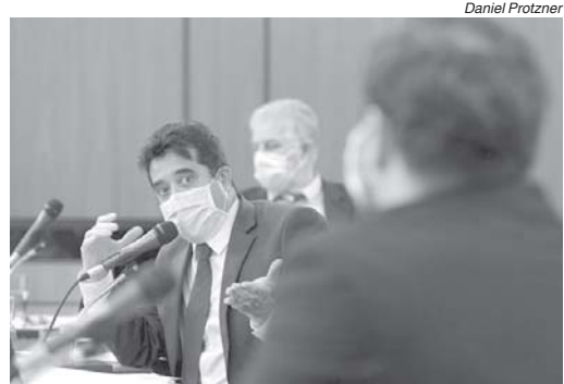
Sargento Rodrigues disse que o acompanhamento dos usuários de tornozeleiras não significaria fiscalizar a vida particular do condenado

O juiz destacou, porém, que resolução do órgão não se sobrepõe às leis, tendo o presidente da comissão também cobrado o cumprimento da Lei Estadual 13.968, de 2001, que regulamenta o artigo 297 da Constituição do Estado, que diz que os sistemas de informações pertencentes a órgãos ou entidades da Administração Pública Estadual relativos à seguran-