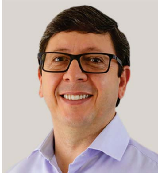
Prefeito Walker Américo Oliveira