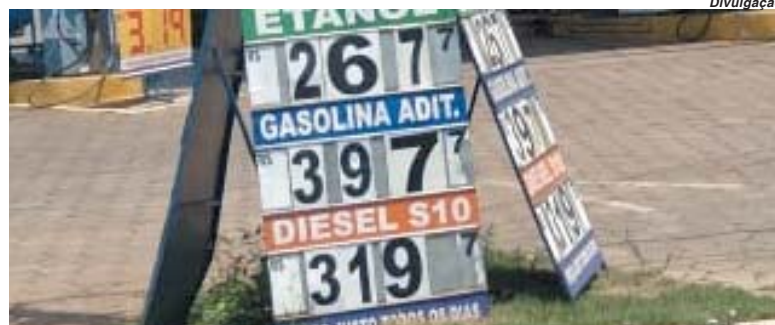
Nesta semana um dos consumidores Paraisense abasteceu seu veículo na cidade paulista de Altinópolis, vejam os preços

consumidores indo abastecer seus veículos no vizinho Estado de São Paulo é enorme. Nesta semana consumidores paraisenses abasteceram em Altinópolis, pagando pelo litro da gasolina R$ 3,977 e etanol R$ 2,677 no Posto Top, conforme nota de abastecimento. Vejam na foto a prova do fato A diferença chega a um Real no preço da gasolina e até setenta centavos no do etanol, diferença a mais cobrada dos consumidores paraisenses, um absurdo.