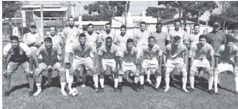
Vila Real venceu o Mambrini por 5 a 1 e lidera o Grupo A

Vila Real e Independente goleiam, mantêm 100% de aproveitamento e assumem a lideranças de seus respectivos grupos