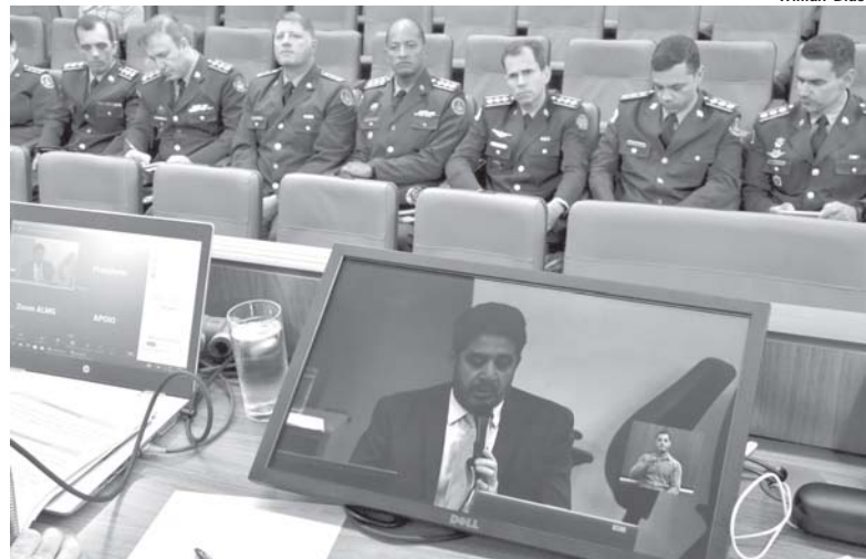
Gestão do Corpo de Bombeiros Militar já foi tema do Assembleia Fiscaliza, em dezembro de 2022

Nesta terça-feira (6/6), a Comissão de Segurança Pública da Assembleia Legislativa de Minas Gerais (ALMG) realizou audiência pública para debater as carências e precariedade da estrutura atual do Corpo de Bombeiros Militar de Minas Gerais (CBM MG), especialmente no que se refere aos recursos materiais e logísticos disponíveis para a adequada prestação de seus serviços.