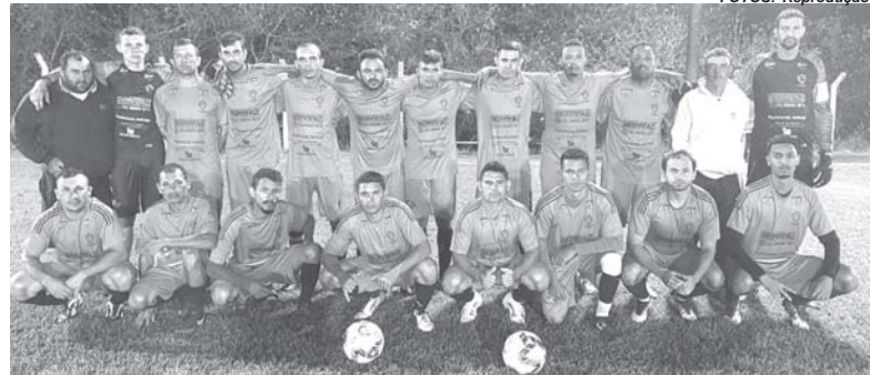
Independente derrotou o Bandeirantes por 5 a 0 e assumiu a ponta isolada no Grupo B do torneio