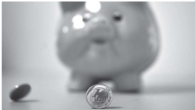
Marcello Casal Jr

Em 2022, a caderneta registrou fuga líquida (mais saques que depósitos) recorde de R$ 103,24 bilhões, num cenário de inflação e endividamento altos. Os rendimen-