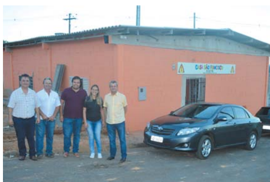
Casa São Francisco