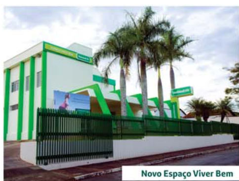
Novo Espaço Viver Bem

A Unimed São Sebastião do Paraíso se orgulha em reverter aos clientes e à comunidade os resultados do seu crescimento.