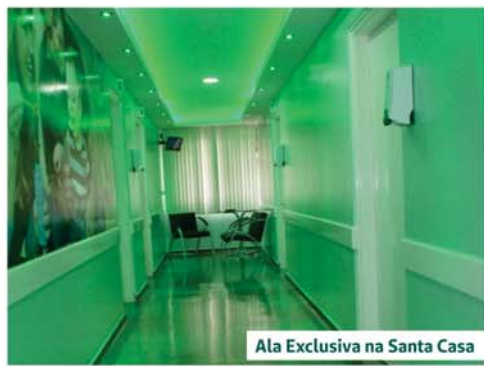
Ala Exclusiva na Santa Casa

7 de abril. Dia Mundial da Saúde. Data celebrada todo dia na Unimed.