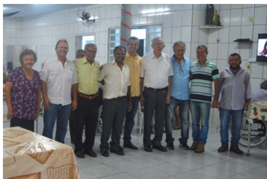
Asilo São Vicente de Paulo