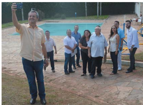
Hospital Gedor Silveira