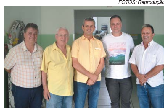
APAE São Sebastião do Paraíso

O deputado estadual Antonio Carlos Arantes (primeiro vice-presidente da Assembleia Legislativa de Minas Gerais) visitou entidades filantrópicas de São Sebastião do Paraíso, que receberam indicação de emendas parlamentares que totalizam R$ 853 mil.