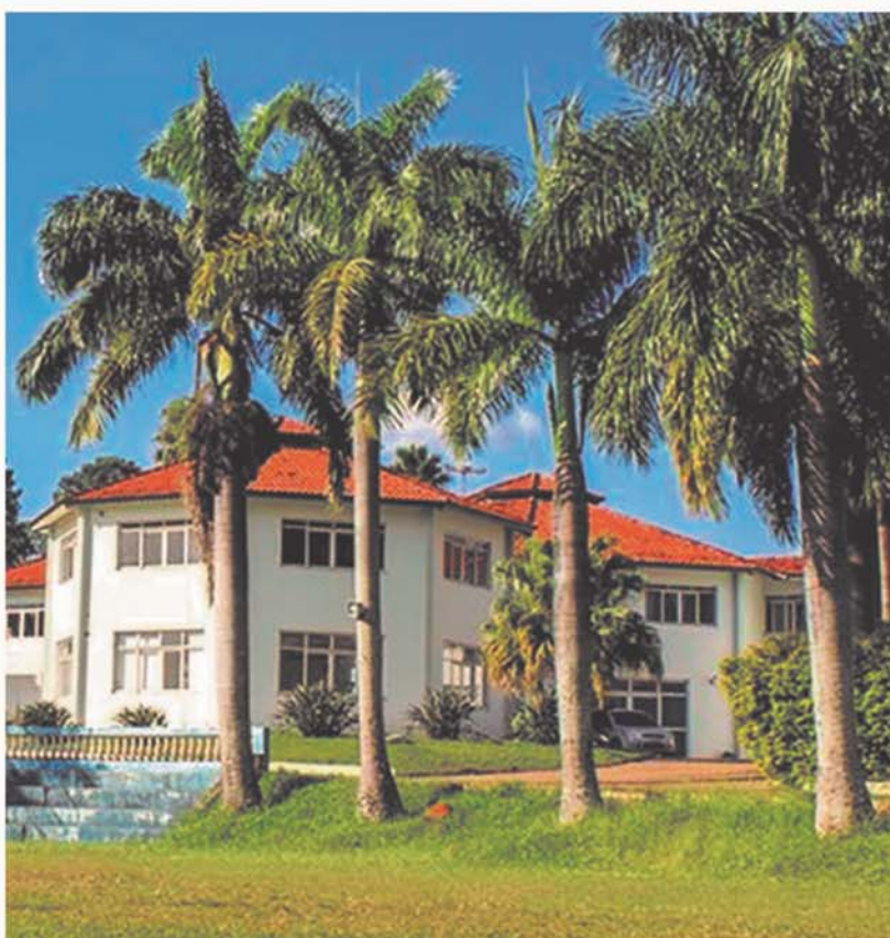
Estrutura que acolhe e proporciona bem estar físico e mental.

Somos uma instituição filantrópica sem fins lucrativos, fundada por idealistas, que em mais de 50 anos de história se tornou referência de saúde mental no Sudoeste Mineiro.