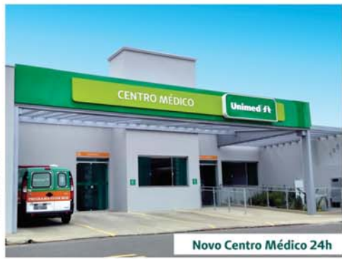
Novo Centro Médico 24h