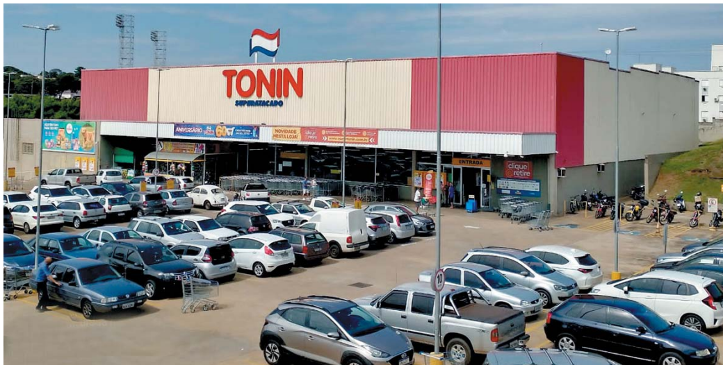
Rede Tonin é um dos maiores grupos do ramo de atacarejo do interior de São Paulo e Sudoeste de Minas Gerais