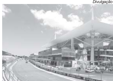
O Circuito de Miami foi erguido aos arredores do Hard Rock Stadium, casa do Miami Dolphins, da NFL

A expansão da F1 pelas redes sociais, antes ignorada com veemência por Bernie Ecclestone, e principalmente a parceria com a Netflix na produção do "Drive to survive" (Dirigir para sobreviver), que acaba de renovar contrato por mais dois anos, onde mostra os bastidores da categoria, tem sido o alicerce que faltava para a aproximação do público, mostrando nuances que a maioria das pessoas que acompanham as corridas não tinham ideia de como as coisas acontecem fora das câmeras de TV.