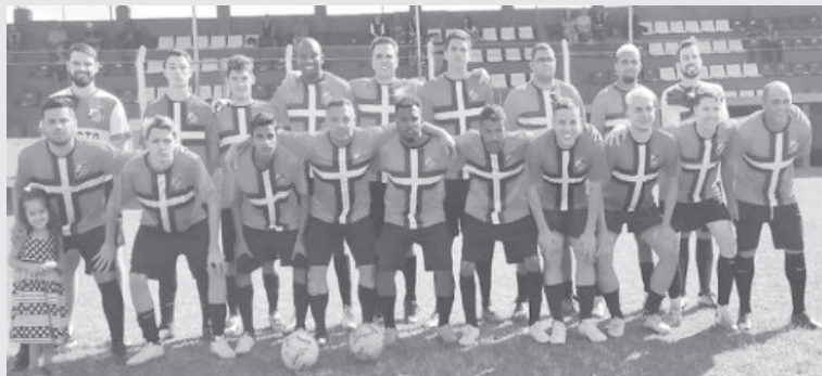
Equipe do Santa Cruz joga para tentar chegar a mais uma decisão da Taça Paraíso

Depois de mais um fim de semana de folga, em função das eleições de 2 de outubro, as equipes que disputam a semifinal da Taça Paraíso de Futebol voltam a campo neste domingo, 9 de outubro. Os jogos serão realizados no período da manhã, às 10 horas, vão definir quais serão os finalistas da competição. A finalíssima que definirá qual time levará o Troféu Ailton Bueno dos Santos, o "Airtão" pode-