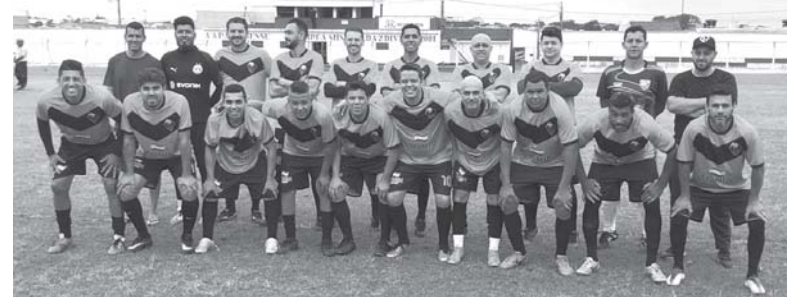
TNB terminou a primeira fase de forma invicta sem se quer empatar um jogo

O campeonato de futebol amador "Quarentão" teve mais uma rodada realizada no último final de semana. A equipe do TNB que lidera a competição conquistou mais um resultado positivo ao golear o GNQ F.C. de Pratápolis por 8 a 1 e segue disparada na liderança. Mesmo sem jogar a Associação Atlética Paraisense se manteve na segunda colocação graças aos resultados negativos de seus concorrentes diretos. Neste sábado não haverá rodada, mas a disputa recomeça no próximo fim de semana já com os jogos da semifinal.