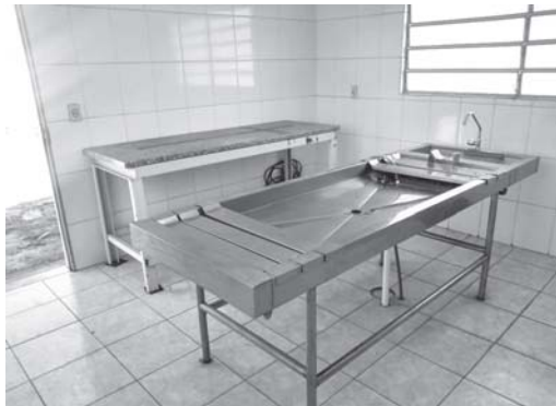
No Cemitério da Saudade em Paraíso, já tem sala com mesas específicas para fazer o serviço de Autópsia

Então a população de São Sebastião do Paraíso está esperançosa do retorno do hemocentro ou posto de coleta de sangue, e que corpos se-