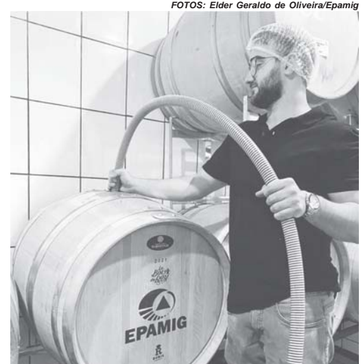
Vinho de inverno Syrah produzido pela vinícola institucional da Epamig

(Com informações de Pedro Veras da Ascom/Epamig)