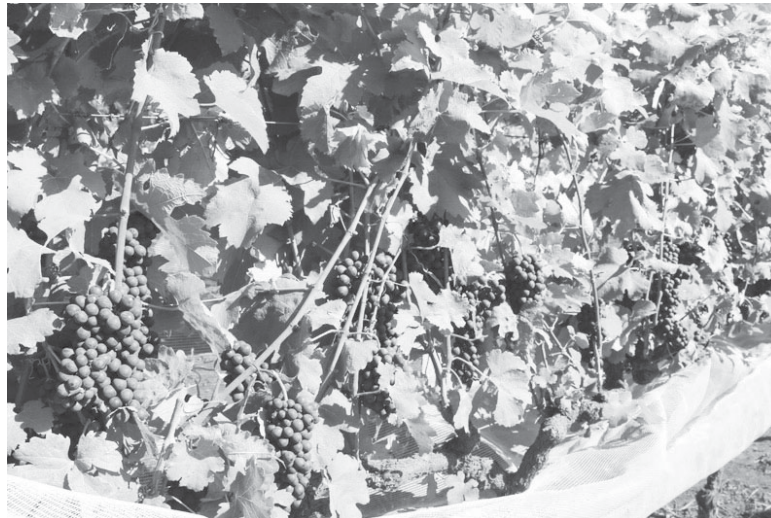
Boas condições climáticas e acompanhamento foram determinantes para qualidade elevada das uvas

O método consiste na alteração do ciclo da videira pela realização de duas podas anuais, o que faz com que o período