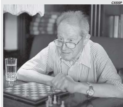
Grande Mestre de xadrez Yuri Averbakh

Averbakh, nascido em Kaluga, 8 de Fevereiro de 1922, tornou-se um Grande Mestre em 1952, juntamente com Petrosian, Taimanov, Geller. Participou do Torneio de Candidatos de 1953 em Zurique ficando em décimo lugar. Seus melhores resultados em torneios são em Vie-