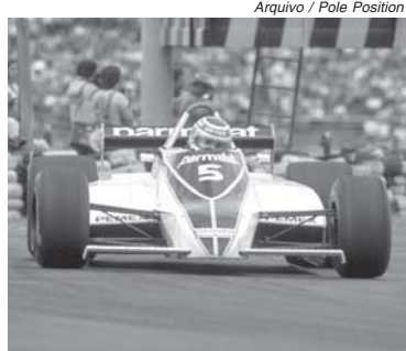
Primeiras vitórias de Nelson Piquet na F1 foram transmitidas pela TV Bandeirantes, em 1980

A Band agora está com a bola toda, ou melhor, com a mão na roda. No final do ano passado a emissora fechou contrato para transmitir todas as etapas da Stock Car e Copa Truck, e de uma só vez acabou ficando com a nata do automobilismo. Todos os GPs da F1 serão mostrados ao vivo na TV aberta, com os treinos livres e classificação ficando a cargo do canal a cabo, Band Sports, que de quebra transmitirá as provas de F2, F3 e também da