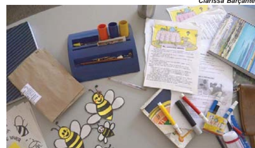
Materiais que não forem utilizados durante o ano letivo devem ser devolvidos ao aluno

DIREITO DE ESCOLHA Os pais podem pagar uma taxa para que a própria escola adquira os itens da lista ou comprem eles mesmos o material para ser entregue à instituição de ensino. Caso decidam pela aquisição dos itens, os pais podem comprar de uma só vez