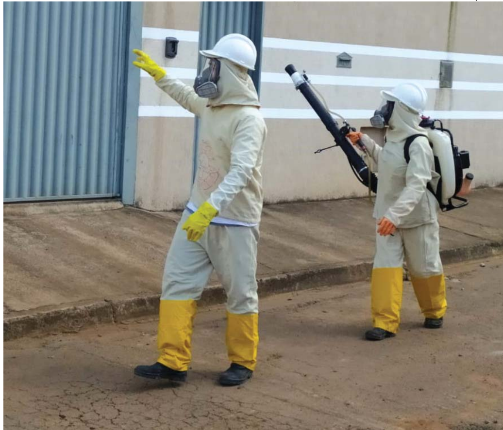
Mobilidade das pessoas que portam o vírus preocupa Departamento de Controle de Zoonose. Apenas 16 casos foram confirmados em janeiro