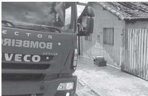
Bombeiros de Paraíso fizeram rescaldo para evitar que novo incêndio terminasse de destruir a residência