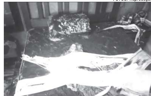
Parte da casa e dos móveis do autor do homicídio foram destruídos pelo fogo