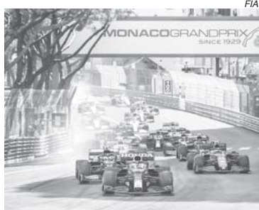
Largada do GP de Mônaco: único momento em que os carros estiveram agrupados

Mas nada foi mais dramático do que ver Charles Leclerc não poder largar, em casa, depois de estar na pole position, por um problema no eixo de transmissão da Ferrari,