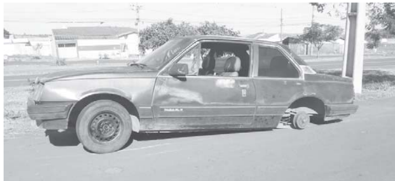
Carcaça de carro velho abandonado, um receptor adequado para ser um foco criador do mosquito da dengue, na Rua Angelo Montovani

Outro fato que a população paraense também tem que se preocupar, e muito, é com a dengue. Quem pensa que a situação está normalizada, está completamente enganado.