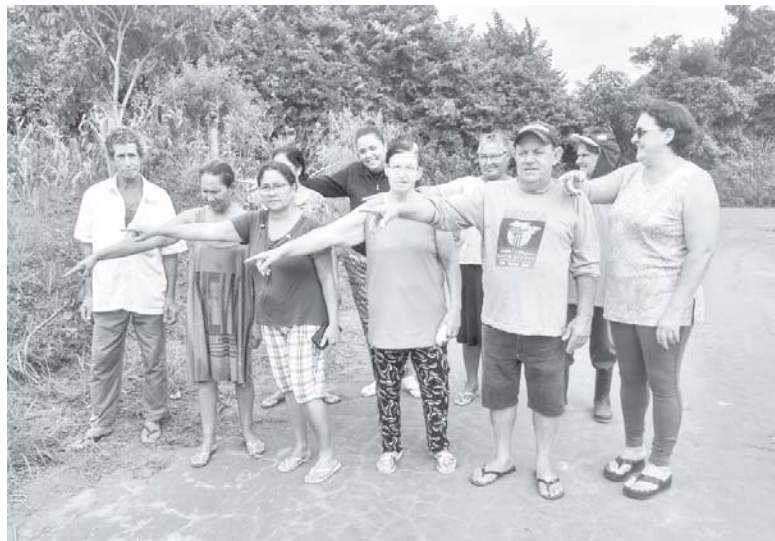
Mais uma vez, moradores do Recanto Feliz esperam com desconfiança a instalação de energia elétrica e as Escrituras Registradas de seus imóveis