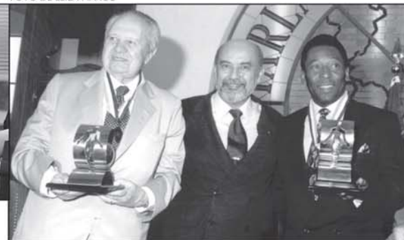
Em abril de 1997, na entrega da Comenda da Ordem do Mérito da Fraternidade Ecumênica, do ParlaMundi da LBV, ao estadista português Mário Soares e a Pelé, o Atleta do Século 20

Aquele sentimento inicial foi crescendo com o passar dos anos, e, na década de 1960, ainda bem jovem, Paiva Netto começou a desenvolver conceitos sobre a palavra "Caridade" e a dar forma e características ao sentido do vocábulo "filantropia".