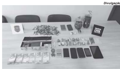
Foram apreendidos diversos materiais entre celulares, drogas, dinheiros, notebooks e dois veículos

Já neste sábado após expedição de mandados de buscas e apreensões a operação especial foi realizada em 10 diferentes endereços da cidade. De