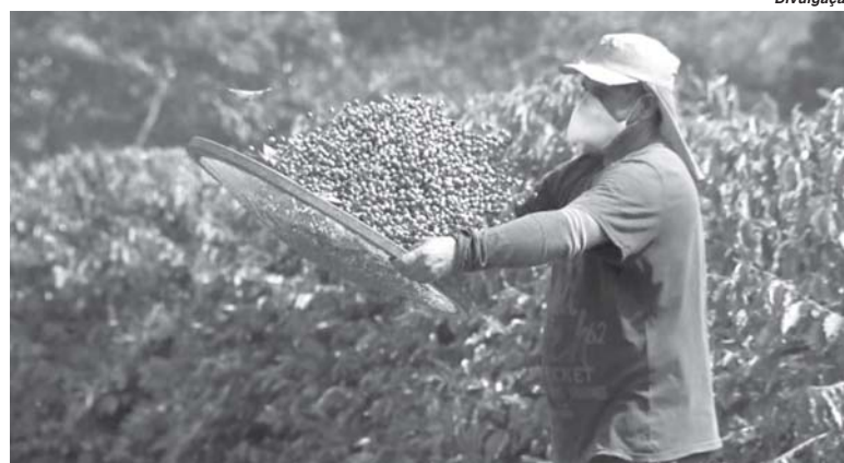
Nesta época do ano boa parte das contratações são de trabalhadores que atuam na colheita de café

No último mês houve 703.921 admissões e de 1.035.822 desligamentos. Com o resultado, o acumulado do ano chegou a -1.144.875 pos-