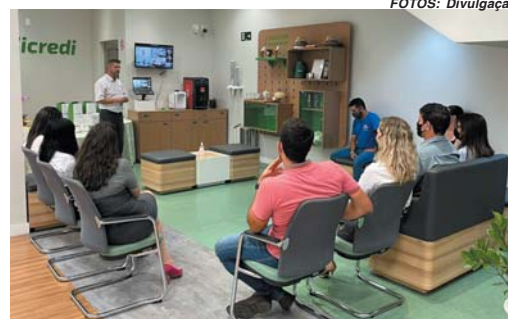
Evento fisital marcou encerramento da primeira turma