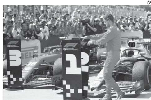
Vettel troca as placas 1 pela 2 de frente à Mercedes de Hamilton

O que fica ruim para a imagem da Fórmula