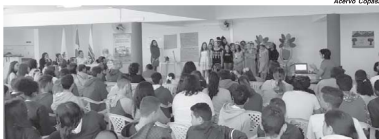
Cerimônia de entrega do Selo Chuá da Copasa

As atividades executadas pela escola foram: recolhimento de óleo de cozinha usado, que foi destinado à fabricação de sabão, evitando o descarte indevido no meio ambiente;