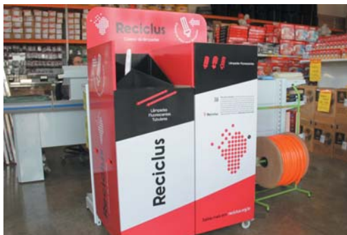
Nas lojas Pessoni Hidro & Elétrica você encontra um coletor exclusivo da Reciclus para coleta de descartes de lâmpadas

A empresa também é Assistência Técnica autorizada da Lorenzetti. A loja 1 atende na Av. Monsenhor Mancini, 888, Vila Dalva; a loja 2 na Av. Brasil, 1.340, no bairro São Judas. Contatos podem ser feitos pelos telefones 3531-6554 ou 9.8877-6554 (também Whats App).