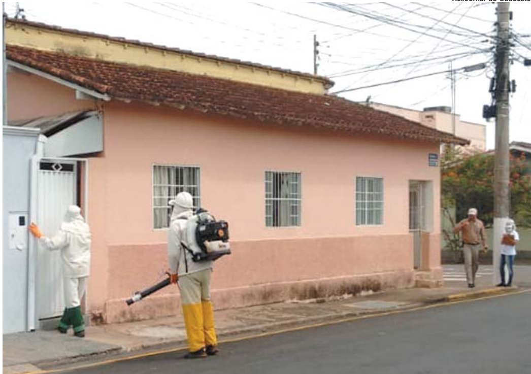
Combate ao aedes aegypt, mosquito transmissor da dengue é feito por funcionários da Vigilância em Saúde em Paraíso

Decreto flexibiliza comércio e estabelece uso obrigatório de máscara em Paraíso