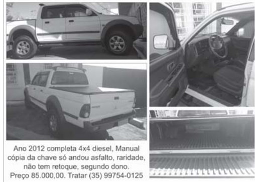
Ano 2012 completa 4x4 diesel, Manual cópia da chave só andou asfalto, raridade, não tem retoque, segundo dono. Preço 85.000,00. Tratar (35) 99754-0125