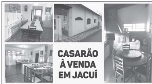
CASARÃO À VENDA EM JACUÍ

• CHÁCARA NAS 3 FONTES: aluga-se, barato, ótimo casarão avarandado do lado do Termas Clube. 99974-2305