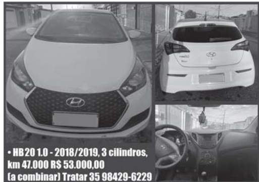
• HB 20 1.0 - 2018/2019, 3 cilindros, km 47.000 R$ 53.000,00 (a combinar) Tratar 35 98429-6229

Vende-se casa na Rua Ana Alarcon Gonçalves, n.º 241 Bairro Morumbi em São Sebastião do Paraíso, contendo sala, cozinha, dois quartos, banheiro, área de serviço coberta. Informações com a proprietária pelo tel. (35) 9 8817 2269 é whatsapp.