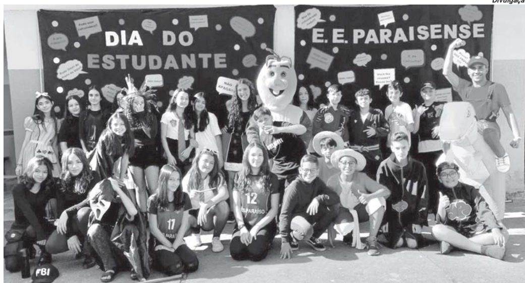
Alunos da E.E. Paraisense não economizaram na criatividade durante o evento escolar

O termo "Cosplay", proveniente do japonês "Kosupure", é uma abreviação de "costume roleplay". A tradução para o português refere-se a fantasiar-se ou disfarçar-se de um personagem. Os participantes e adeptos dessa modalidade são chamados de cosplayers, e a essência do Cosplay é