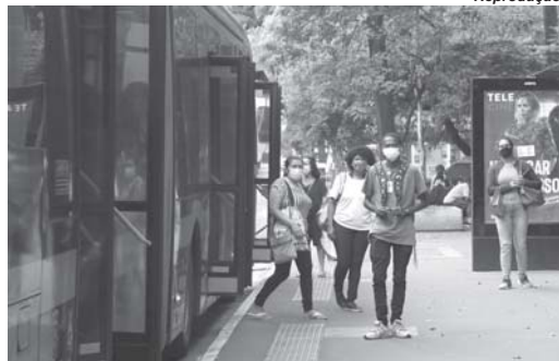
Por Pedro Rafael Vilela Repórter da Agência Brasil Brasília

Ainda segundo o boletim, 29.885.580 pessoas se recuperaram da doença