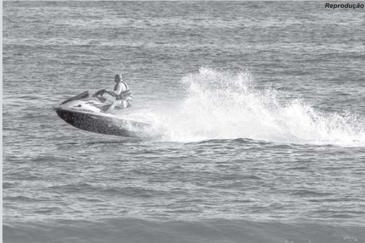
Por Luciano Nascimento Repórter da Agência Brasil São Luís

As normas valem para atividades de esporte e lazer