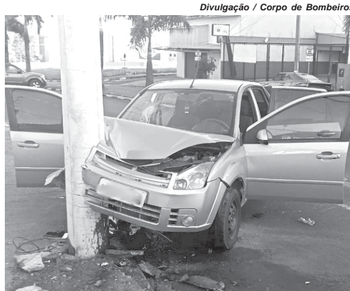
Veículo e poste ficaram parcialmente destruídos com a colisão contra o poste na Avenida Zezé Amaral

Segundo informações o veículo estava com quatro ocupantes. De acordo com informações, acredita-se que o condutor tenha dormido ao volante, pelo fato de haver ausência de sinais de frenagem na faixa de rolamento. Para o atendimento as vítimas foram mobilizadas viaturas de resgate e de salvamento dos Bombeiros e uma Unidade de Suporte Básico, do Samu.