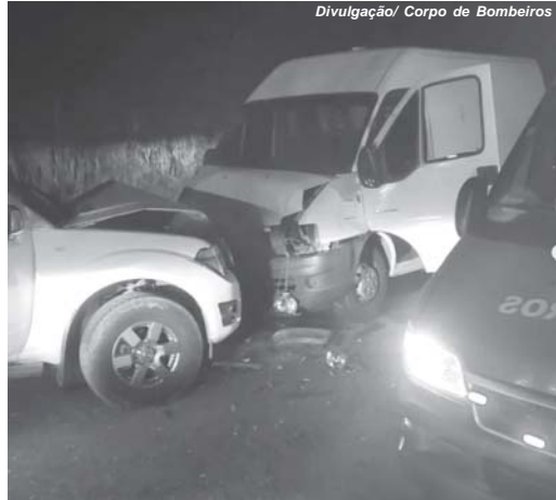
Causas do acidente serão verificadas onde um motorista ficou ferido e foi socorrido

Um acidente registrado na noite de sexta-feira, 20, por volta das 21h40 deixou um motorista ferido. O acidente foi registrado na altura do km 387 da rodovia MG-050 e envolveu uma caminhonete e uma van que trafegavam em sentido contrário. O trânsito ficou parcialmente interrompido e as causas da colisão frontal serão investigadas.