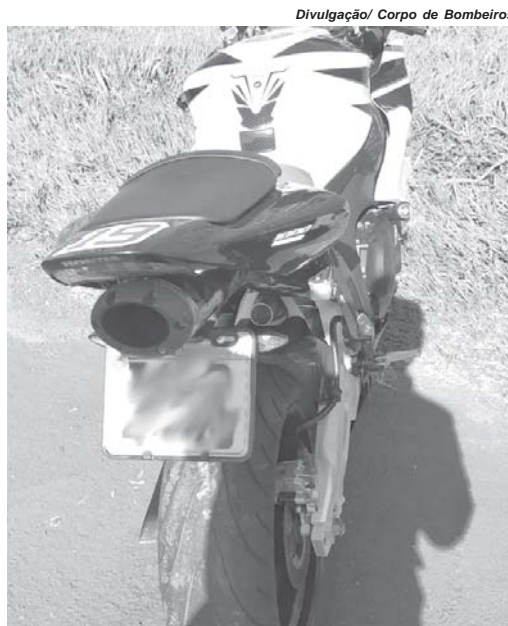
Com o impacto da batida motociclista foi arremessado a vários metros de distância do local do acidente

do consciente, mas estava desorientado e com dificuldade respiratória. Durante o atendimento foi identificada uma fratura aberta de clavícula e sinais de que pudesse estar evoluindo com pneumotórax hipertensivo. Ele foi removido até a Emergência da Santa Casa de Paraíso e seu quadro foi considerado grave.