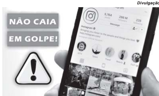
Impunidade faz crescer número de golpes e vítimas nas redes sociais

Um amigo da professora foi contatado pelo golpista estranhando o tipo de abordagem e a fala sobre a venda de produtos e desconfiou. "Falei com ela por outro meio e descobri que era uma tentativa de golpe, pois, sei que ela está em viagem e teve o Instagram hackeado", conta um jornalista que também preferiu ter seu nome reservado. Ao mesmo tempo ele alerta para que as pessoas fiquem atentas para a oferta de produtos e "pedidos de dinheiro, situações que podem parecer comum, mas não é", observa.