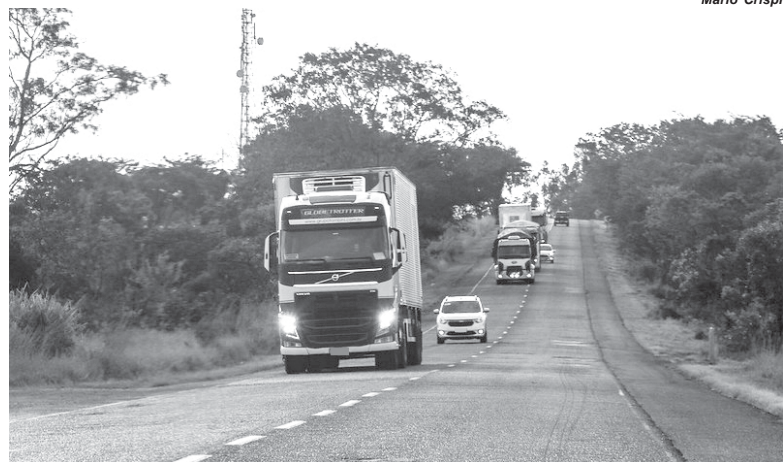
Medida visa proporcionar mais segurança às pessoas que viajam a passeio nessas datas

Nestes dias e horários, estarão proibidos de circular os veículos de carga tipo bitrens, treminhões e rodotrens (com mais de duas unidades, sendo uma trator e as demais tracionadas e comprimento entre 19,80 e 30 metros). A medida inclui as cegonheiras (com duas unidades e de 22,40 metros de comprimento); cargas indivisíveis (que excedam