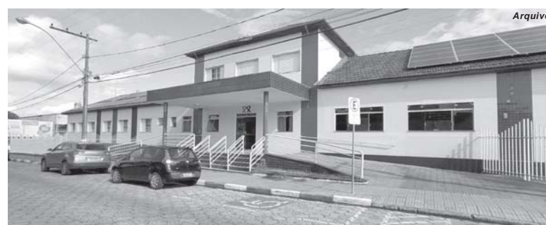
Vinte sete pessoas entre internos e funcionários do asilo estão em tratamento contra a covid-19

O Asilo São Vicente de Paulo abriga 67 asilados. Se somado com os funcionários são cerca de 105 pessoas que atuam na instituição. Os 24 idosos contaminados com coronavírus foram diagnosticados