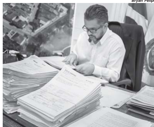
Prefeitura conseguiu pagar grande parte das dívidas e ainda realizar investimentos

“Com o pagamento dessas dívidas em 2021, não iremos precisar nos preocupar com elas neste ano. Então, a tendência é que tenhamos recursos para que ao longo da gestão possamos ir quitando a dívida fluante. Nosso objetivo é pagar pelo menos 50% desta dívida, caindo de R$ 8 milhões para R$ 4 milhões, além de nesses dois primeiros anos de