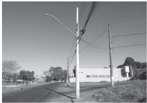
Atendendo denúncias e alertas, CEMIG mandou trocar poste esfacelado na Av. Jerônimo Diogo Pereira no Bairro San Genaro