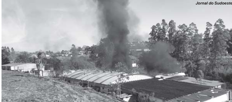
Jornal do Sudoeste

Por volta das 9 horas um grande volume de fumaça chamou a atenção de pessoas que passavam nas proximida-