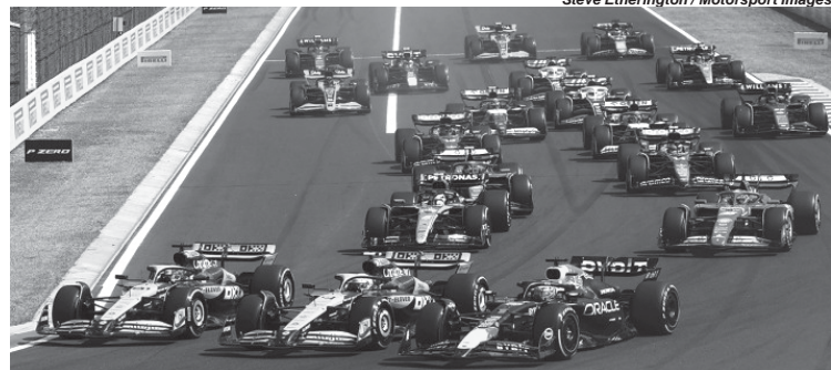
Uma linha de três na primeira curva foi o sinal de que o GP da Hungria seria quente. E foi.

O GP da Hungria foi tenso e intenso desde o começo. Uma corrida muito conversada no rádio das equipes, um leque de estratégias na mesa e que resultou no sétimo vencedor diferente da temporada. Aos 23 anos, o australiano Oscar Piastri tornou-se o 115º piloto a vencer uma corrida de F1 no dia em que Lewis Hamilton conquistou o 200º pódio da carreira em uma corrida onde a Mercedes não estava no páreo para andar na frente.