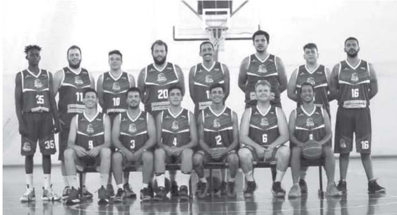
Atletas remanescentes do Paraíso Basquete voltam às quadras para representar a cidade nesta semana

Equipe paraisense enfrenta time de Passos nesta quarta-feira, no CSU 2. Jovens das categorias de base vão integrar o elenco na partida