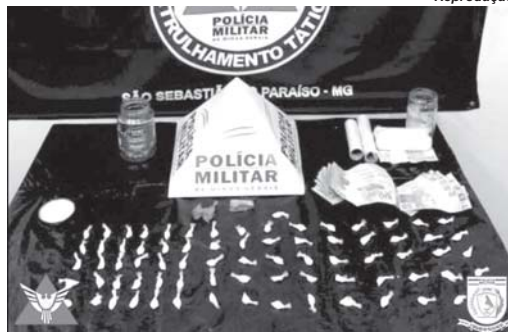
Dinheiro e 50 porções de cocaína prontas para o comércio foram encontrados na casa e no carro do casal

A Polícia Militar recebeu denúncia narrando que na referida residência estaria ocorrendo grande movimentação de usuários de drogas. Logo depois de abordar o motociclista se deslocaram até local e se depararam com um ho-