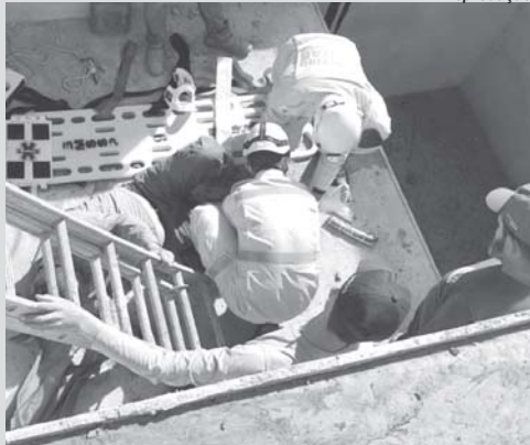
Vítima foi socorrida por uma equipe dos bombeiros e conduzida à Santa Casa

Homem de 43 anos teve fratura no tornozelo depois de se acidentiar em uma construção no Parque Industrial II