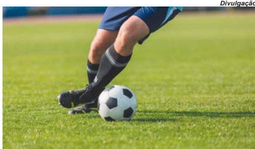
Neste final de semana mais três partidas movimentam o campeonato de jogadores veteranos

Apenas uma partida foi realizada pelo campeonato no final de semana de carnaval. No Estádio Comendador João Alves, o Bengala confirmou a boa fase e derrotou o Veteranos de Pratápolis por 3 a 0. Com o resultado o time de Guaxupé assumiu a liderança do torneio com a melhor cam-