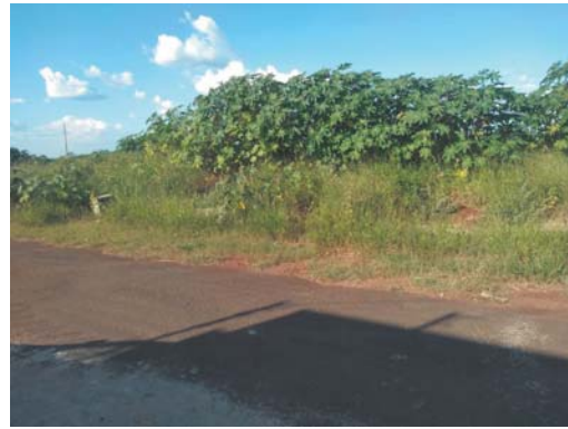
Por toda extensão da Rua José Luiz Filho, no Jardim Diamantina, vejam o tamanho deste matagal

O mesmo fato preocupante e horroroso, está acontecendo em três áreas verdes que pertencem ao Patrimônio Público Municipal e uma gleba de propriedade particular, ambas áreas