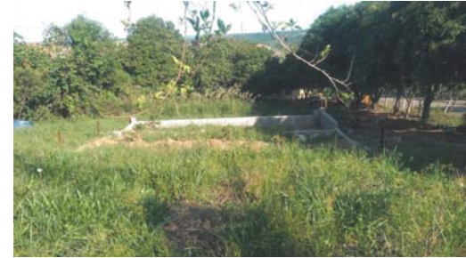
Conforme fotos registradas, em uma área verde na rua Geraldo Alves da Costa, no Parque São Francisco, está se iniciando mais uma edificação residencial

denúncia que numa área verde localizada na rua Geraldo Alves da Costa, no Parque São Fran-