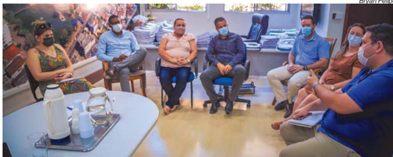
Gestores da microrregião de Saúde de São Sebastião do Paraíso se reuniram para debater a situação

Ainda, conforme as informações, os leitos disponibilizados pelos gestores municipais poderão utilizar dos equipamentos médico-hospitalares cedidos pela Secretaria de Estado de Saúde de Minas Gerais, nos termos dos instrumentos de cessão e/ou permissão de uso. Os diálogos para tratar sobre essa situação se iniciaram ainda no final de 2021, quando o Ministério da Saúde